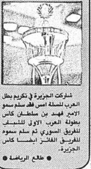
شركت الجزيرة في تكريم بطال العرب للسلة امس فقد سلم سمو الامير فهد بن سلطان كاس بطولة العرب الاولي للشباب للفريق السوري ثم سلم سموه للفريق الفائز ايضا كاس الجزيرة.