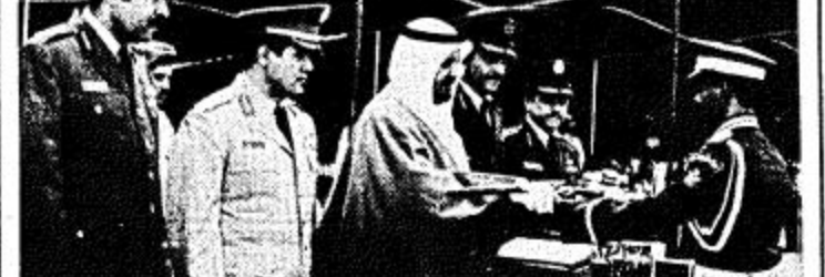
الأمير عبدالرحمن رمى حفل تفريغ السفينة من طلبة كلية الملك فيصل الجوية اس

الأمير عبدالرحمن رمى حفل تفريغ السفينة من طلبة كلية الملك فيصل الجوية اس كتب / عوض مغل القحطاني: اعرب صاحب السمو الملكي الامير عبدالرحمن بن عبدالعزيز نائب وزير الدفاع والطيران والمنتش العام عن سعادته بتفريغ السفينة الثالثة من طلبة كلية الملك فيصل الجوية. وتمني سموه لهم ونذيرهم النجاح في حياتهم المستقبلية.