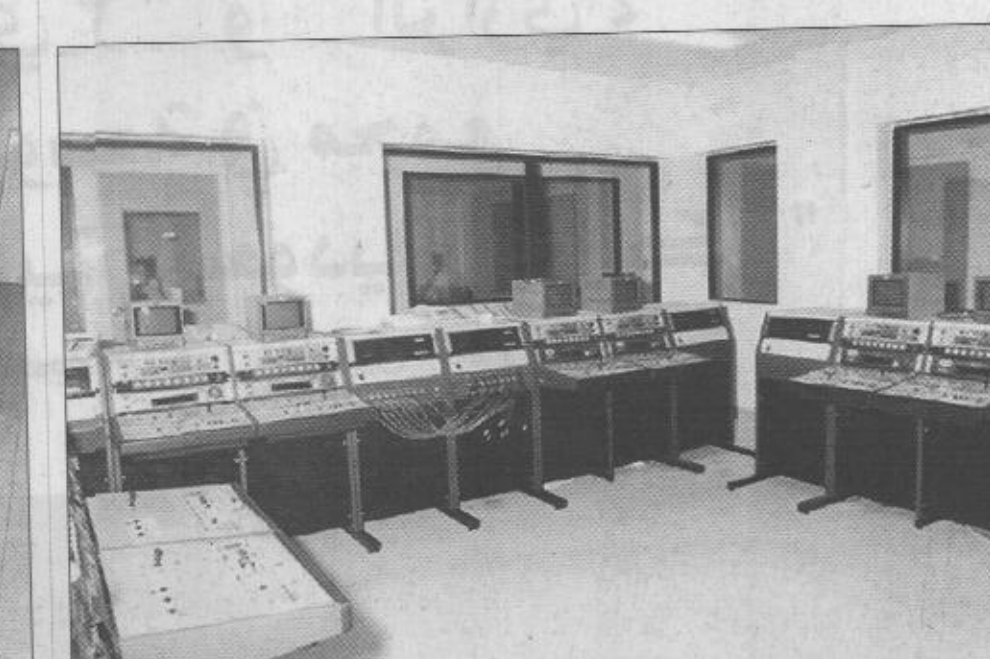
شبكة تلفزيونية مغلقة