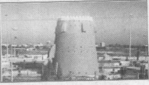
ملحق يومي بمناسبة زيارة سمو ولي العهد للمنطقة الشرقية