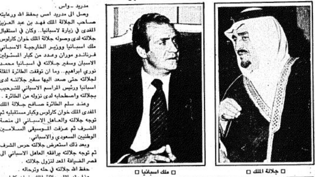
جلالة الملك □ ملك اسبانيا □