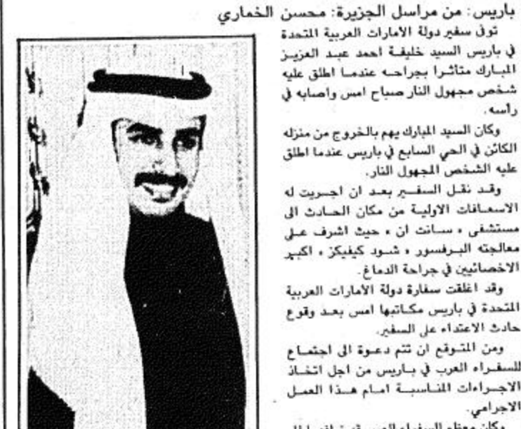
الرياض - واس عظم ترمته لهجوم ملكي وفدأة سفير دولة الإمارات في باريس. وكان السيد المبارك يوم الخروج من منزله الكائن في الحي السابع في باريس عندما أطلق عليه الشخص المجهول النار. وقد نقل السفير بعد أن أجريت له الإسعافات الأولية من مكان الحادث إلى مستشفى « سانت أن » حيث أشرف على معالجته البروفسور « شوب كيكيز » كبير الاختصاصيين في جراحة الدماغ. وقد انطلقت سفارة دولة الإمارات العربية المتحدة في باريس مكانها أمس بعد وقوع حادث الاعتداء على السفير. ومن المتوقع أن تتم دعوة إلى اجتماع للسفراء العرب في باريس من أجل اتخاذ الإجراءات المناسبة أمام هذا العمل الإجرامي. وكان معظم السفراء العرب قد توافقوا إلى مكان الحادث لمعرفة اللابسات التي رافقت الجريمة ومراقبة أعمال الإسعاف الأولية عن كتب. وتذكرت مصادر الشرطة الفرنسية أن جريمة اغتيال سفير الإمارات في باريس ارتكها شخص متخفي وقد لاقه في الفترة وادت إلى وفاته ثم فر الجاني هارباً.