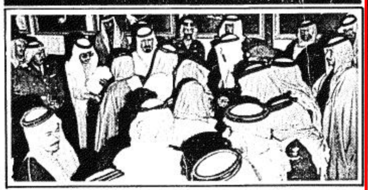
الرياض - واس استقبل صاحب السمو الملكي الأمير عبد الله بن عبد العزيز نائب جلالة الملك في مكتب سموه في الحرس الوطني أمس جموعاً من المواطنين الذين قدموا للسلام على سموه. وقد حضر المقابلة صاحب السمو الملكي الأمير بدر بن عبد العزيز نائب رئيس الحرس الوطني.