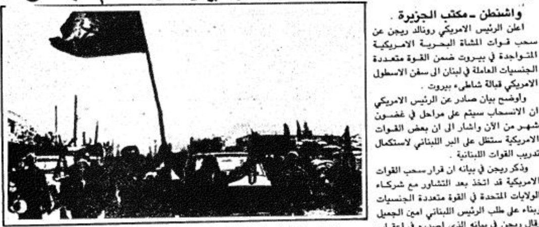
قوات الميليشيات اللبنانية المعارضة في الحزب التقدمي الاشتراكي ترفع علمها فوق موقع الجيش اللبناني كانت قد استولت عليه القوات المعارضة يوم الثلاثاء ويقع جنوبي مطار بيروت

المارييز ينسجون من بيروت إلى البحر.. والبريطانيون يلجأون إلى إحدى أنسفن.. والقوة الإبطائية تبدأ انسحاباً تدريجياً.. والفرنسيون وحدهم الباقون