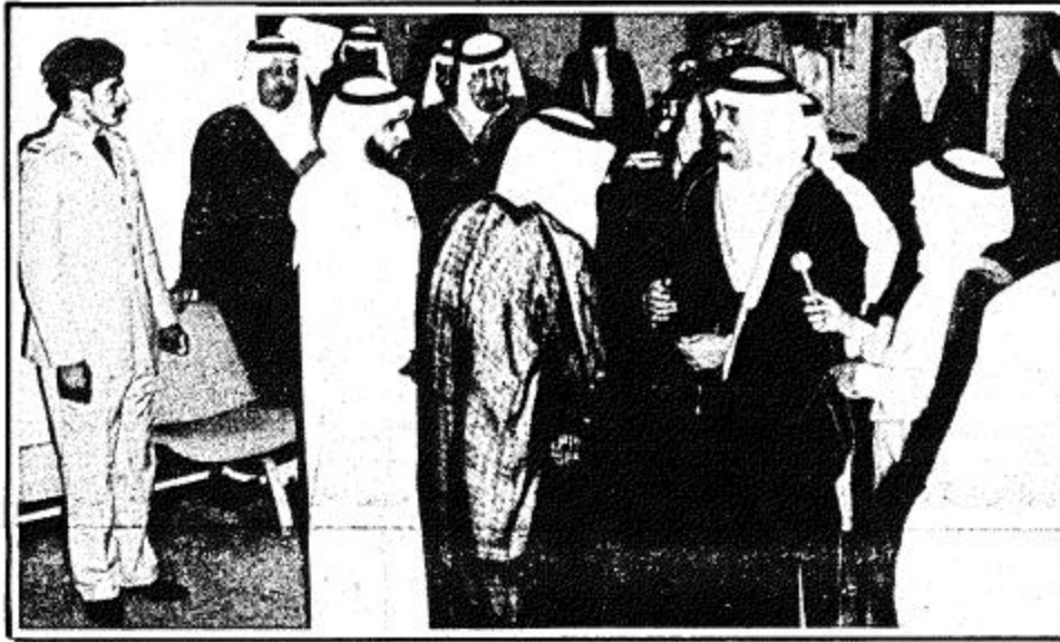
الامير فهد يتحدث الى عبدالله بشارة

صاحب السمو الملكي الامير عبدالله بن عبدالعزيز... اصحاب السمو... ايها الأخوة... في هذه المناسبة التاريخية اقف اجلايا وكبارا لاصحاب الجلالة والسمو الذين يحكمهم ويؤيدونهم