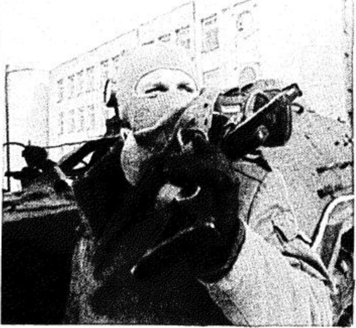
رجل ميليشيا عسكرية سوفيتي مقنع يقف امام اكلاديمية الشرطة حيث يقوم جنود الجيش باعمال الدورية في شوارع فيلنيوس

الله ان يفيض عليهم رحمته ويسكنهم فسيح جناته ويلهم ذويههم الصبر والسؤلان. ومن جهة ثانية بعث خادم الحرمين الشريفين الملك فهد بن عبدالعزيز برفقة لفخامة رئيس جمهورية باكستان هذا نصها. فخامة الاخ الرئيس غلام اسحاق خان.. رئيس جمهورية باكستان الاسلامية - حفظه الله - اسلام آباد. السلام عليكم ورحمة الله وبركاته وبعد: فقد تآثرت والزعتجت كثيرا عندما علمت بنشأ الزلزال الذي تعرضت له باكستان الشقيقة وراح ضحيتها ما الله ان يفيض عليهم رحمته ويسكنهم فسيح جناته ويلهم ذويههم الصبر والسؤلان. ومن جهة ثانية بعث خادم الحرمين الشريفين الملك فهد بن عبدالعزيز برفقة لفخامة رئيس جمهورية باكستان هذا نصها. فخامة الاخ الرئيس غلام اسحاق خان.. رئيس جمهورية باكستان الاسلامية - حفظه الله - اسلام آباد. السلام عليكم ورحمة الله وبركاته وبعد: فقد تآثرت والزعتجت كثيرا عندما علمت بنشأ الزلزال الذي تعرضت له باكستان الشقيقة وراح ضحيتها ما