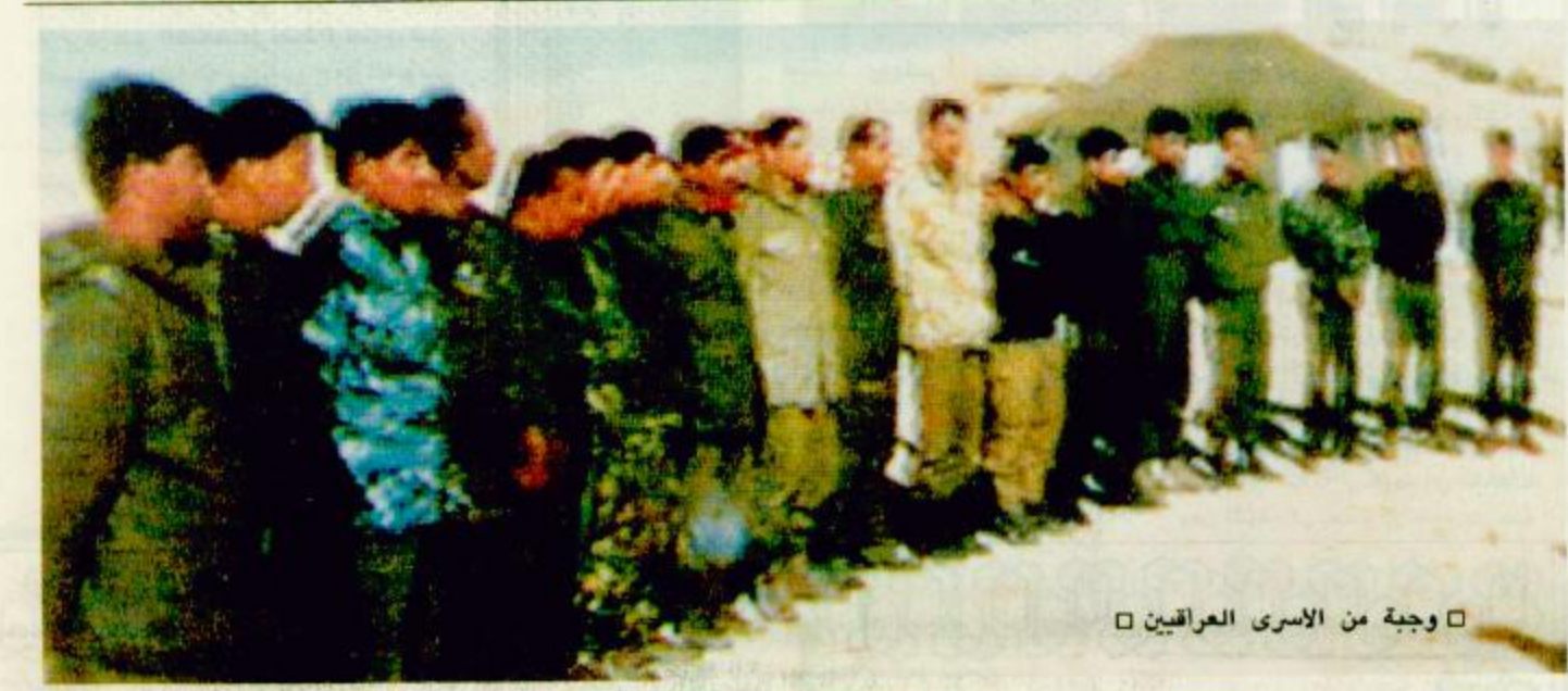
○ وجبة من الاسرى العراقيين □