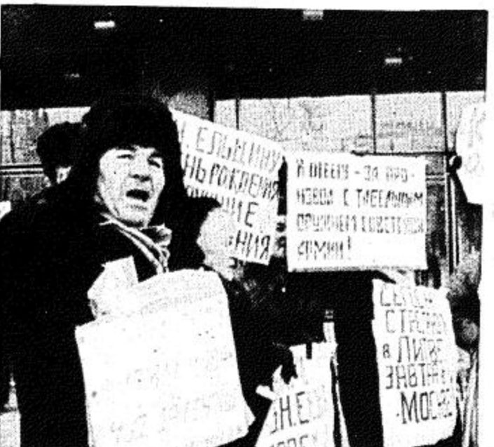
بعض سكان العاصمة السوفيتية موسكو يحملون لافتات تشجب التدخل العسكري في منطقة البلطيق .. وكانوا قد تجمعوا يوم الجمعة الماضي امام مبنى الاتحاد الروسي فيلديراي

القوات هناك مروضها ان الجيش وقوات الامن في عنقه وذمته. ودعا الملك الحسن الرئيس العراقي الى الانسحاب من الكويت وقال مخاطبا صدام حسين ان المفتاح بيدك ليس فقط بالنسبة للشعب العراقي الذي له الحق في الحياة بل والشباب العراقي الذي له حقه في الحياة والاطفال العراقيين الذين لهم الحق في الحياة والمفك العربي الاسرائيلي الذي له حقه في الخروج الى الوجود. واوضح جلالة الملك الحسن الثاني ان الدول العربية وهيئة الامم المتحدة غير متفقة مع رئيس النظام العراقي في احتلال دولة الكويت.