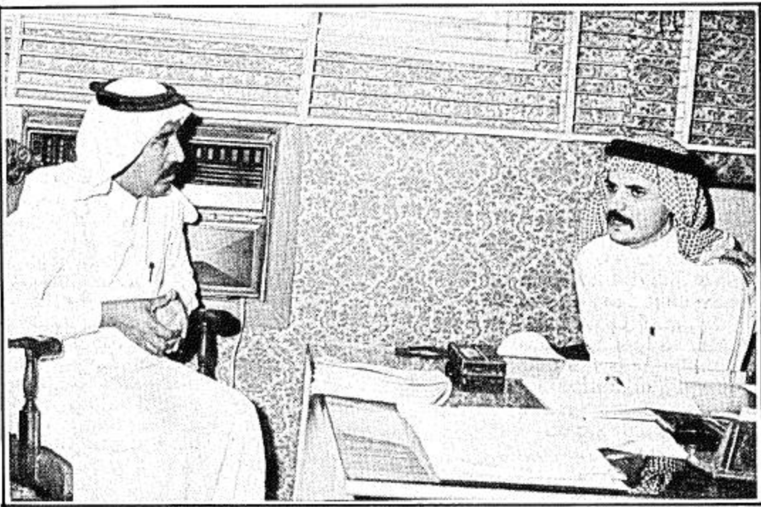
الحواسي يتحدث للزميل المصيب

124218 واجتروا قسم الاسماك و 2911074 مراجع للمراكز الخارجية