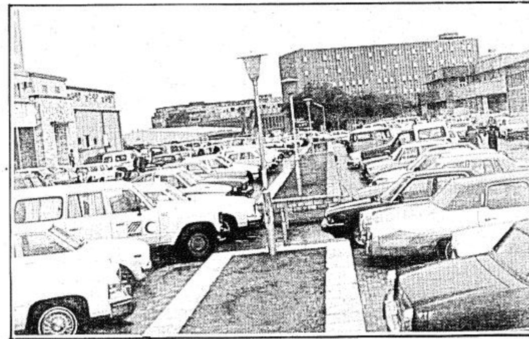
اللقطة جانبية للمستشفى