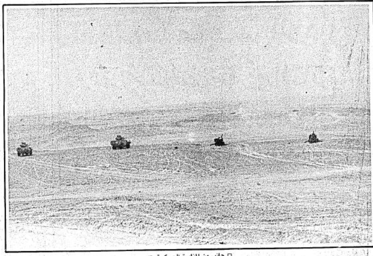
□ جانب من المناورة العسكرية □