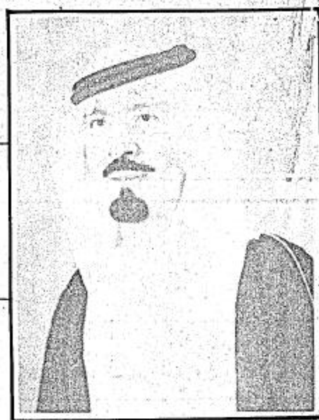
□ سمو الامير عبدالله بن عبد العزيز □

٣ آلاف قتيلا.. في المرحلة الأولى.. وبعد ثلاث سنوات تصبح ١٨ ألف قتيلا