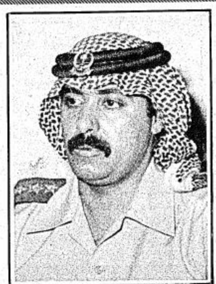
□ سمو الامير متعب بن عبدالله بن عبد العزيز □

● الأمير متعب بن عبدالله: مناهج خاصة للدارسين في الكلية