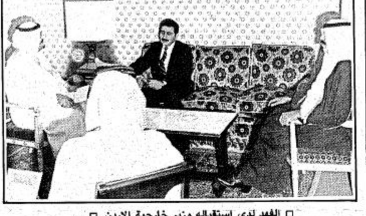
الفهد لدى استقباله وزير خارجية الاردن