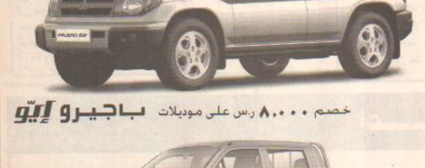
خصم 8,000 ر.س على موديل 99 الت 200 بغمارتين