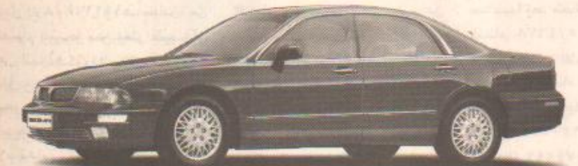
خصم 14,000 ر.س على موديلات سيجما