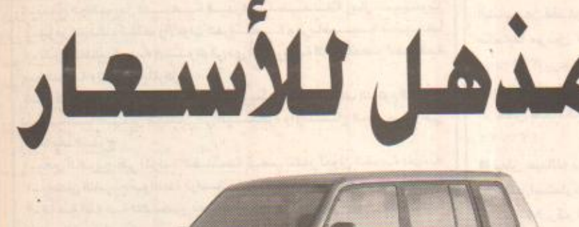
خصم 8,000 ر.س على موديلات باجيرو إيڤو