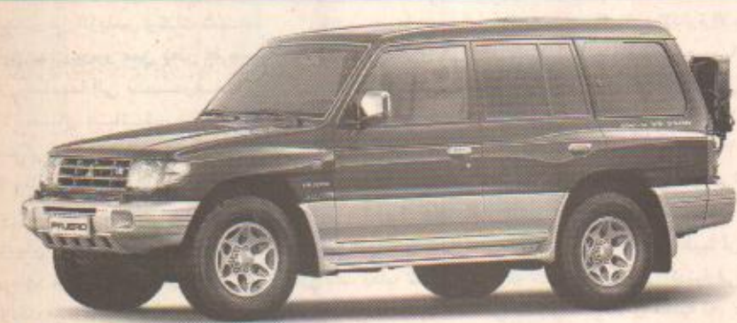
خصم 40,000 ر.س على موديلات 99 باجيرو

الأمريكي في منطقة جنوب شرق آسيا وراء التجاوب مع إسرائيل في هذا الشأن وذلك رغم موقف الصين المؤيد على طول الخط للقضايا العربية. وأضاف أن الدول العربية تدرس حاليا معطيات هذا التعاون العسكري الذي أعلنته إسرائيل خلال زيارة الرئيس الصيني الأخيرة لمنطقة الشرق