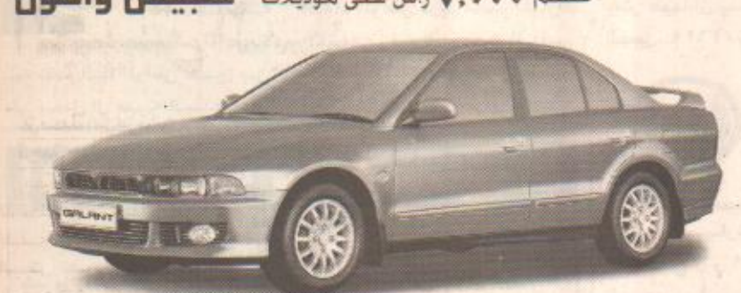
خصم 10,000 ر.س على موديلات جاننت في آر