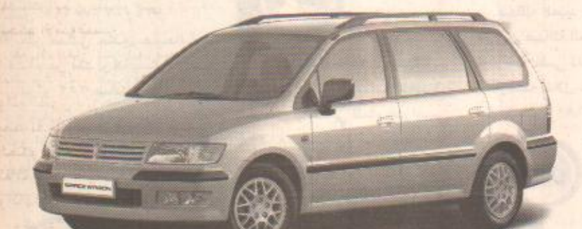
خصم 7,000 ر.س على موديلات سيبس واغون