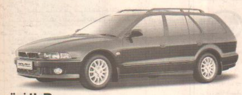
خصم 8,000 ر.س على موديلات جاننت ستيشن واغون