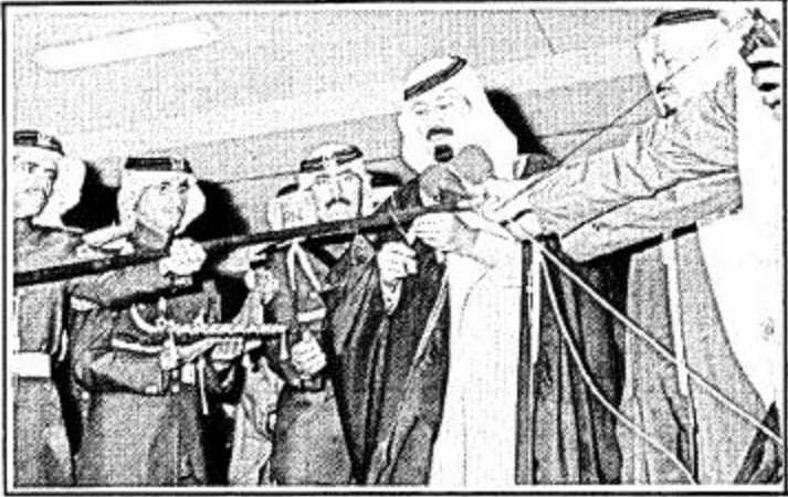
□ نائب جلالة الملك سمو الأمير عبد الله بن عبد العزيز يفتتح الكلية

رسالة من نائب جلالة الملك لأمير الكويت الكويت - واس تسلم سمو الشيخ جابر الاحمد الصباح أمير دولة الكويت رسالة من أخيه صاحب السمو الملكي الأمير عبد الله بن عبد العزيز نائب جلالة الملك المفدى.. وذكر راديو الكويت ان سفير المملكة لدى الكويت السيد محمد فهد العيسى قد قام بتسليم الرسالة لسمو الشيخ جابر خلال مقابلة له صباح اليوم.