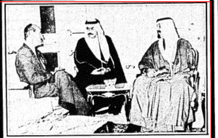
سمو ولي العهد يستقبل السفير البلجيكي

التباني ومعاي وكيل وزارة الخارجية للشؤون السياسية عبد الرحمن منصوري وسفير جلالته في باريس جميل اسماعيل الشوري الادارة العربية السفير اسماعيل الشوري ورئيس الادارة الاسيوية السفير احمد مؤمنة والقائم بأعمال سفارة المملكة في طهران مروان الرومي وعدد من المسؤولين بوزارة الخارجية. وفي سؤال لندوب وكالة الأنباء السعودية وجهه صاحب السمو الملكي الامير سعود الفيصل وزير الخارجية حول المواضيع التي سيتم بحثها في المباحثات الرسمية التي سيجريها سموه مع معالي وزير خارجية الجمهورية الاسلامية الإيرانية اجاب سموه ان المباحثات ستستغرق اولها بعض الاضواء في المنطقة وعلاقتها دولها بعض والمسؤوليات المشتركة لتلك الدول تجاه أمن واستقرار المنطقة. وحول سؤال عما اذا كان موضوع الحرب العراقية الإيرانية سيكُون من بين المواضيع التي ستبحث قال سموه انه من الطبيعي ان يبحث هذا الموضوع لانها حرب بين دولتين اسلاميتين وجارتين للمملكة. فالعقيدة والجوار ترحمان عليا ان نذل ما في وسعنا لاجل حل سريع لانهاء هذه الحرب. ولقد كان لهذا الموضوع كما تعلم محمد حسني لوساتي والقائم بالأعمال الإيرانية لدى المملكة محمد حسين طارمي كما حضر الاجتماع من الجانب السعودي معالي وكيل وزارة الخارجية عبد العزيز