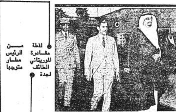
● لحظة من مقابلة الرئيس مطامير الطائف متوجها لجدة

● بحث بعض قضايا العالم العربي والإسلامي وعدد من الأمور التي تتربها المنطقة