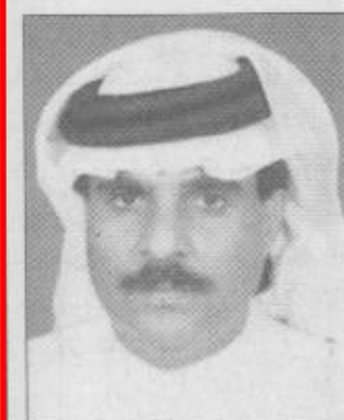
بقلم / فهد بن سعد البلوي