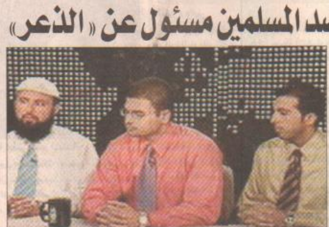
طلاب الطب الثلاثة