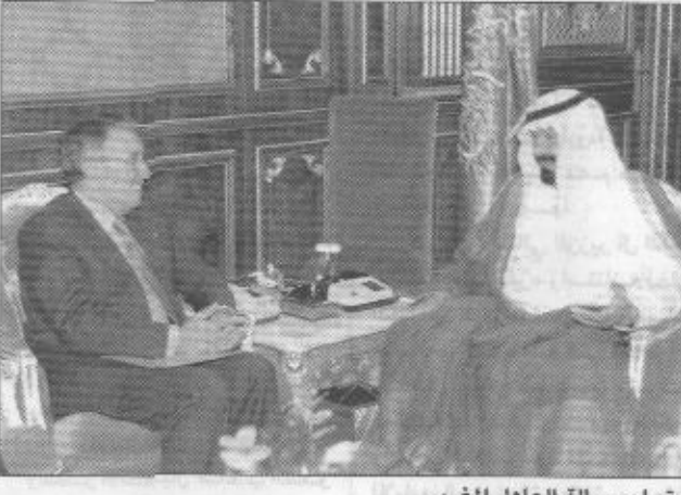
تسلم رسالة المعامل المغربي