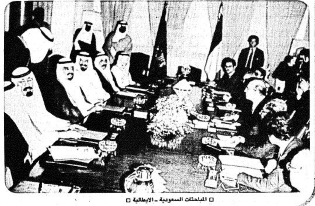
المحادثات السعودية - الإيطالية □