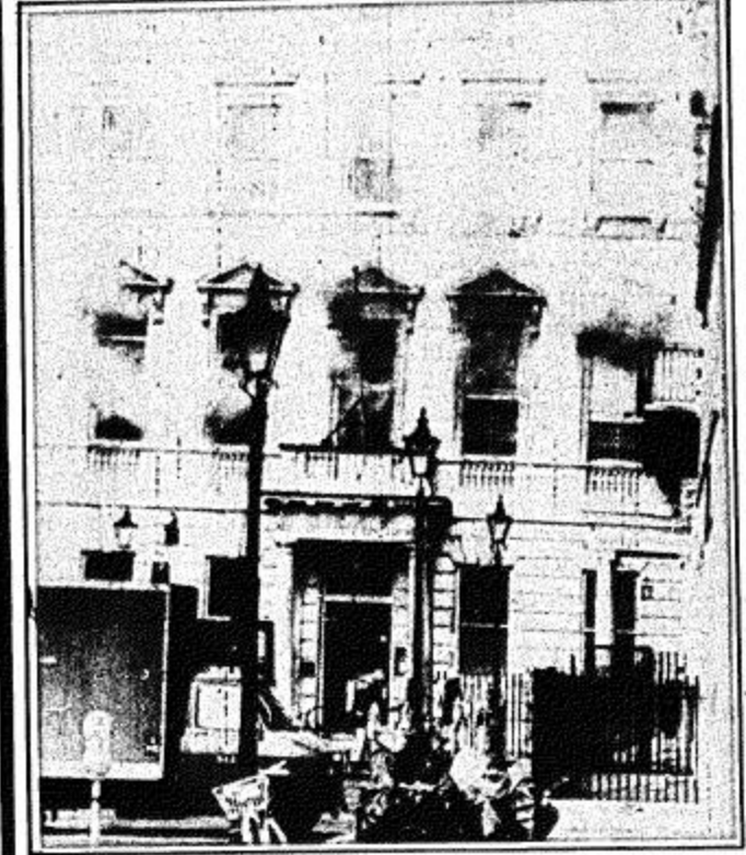
الدخان يتصاعد من مبنى السفارة الليبية في لندن

لندن - رويترز - قال البويسي البريطاني ان حريقا شب في السفارة الليبية السابقة في وسط لندن امس. وقد التهمت النيران الدور الارضي من المبنى الذي يتكون من خمسة ادوار في ميدان سانت جيمس وكان في نيسان ايريل الماضي مسرحا لحصار بعد اطلاق رصاص من الداخل مما ادى الى مصرع شريفة بريطانية.