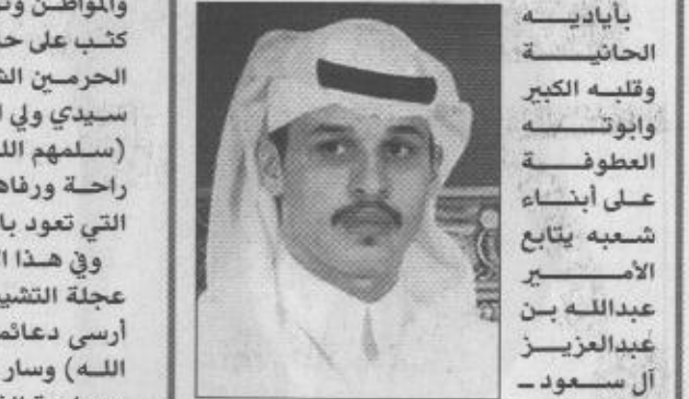
ب/قلم / سعيد عجاجية

التقدم في كافة المجالات لتحقيق الازدهار والرفاهية لابناء المنطقة الشرقية ولأن المملكة تؤمن بالحاضر وتتطلع للمستقبل فقد بدأت التوجه الى احتضان الأجيال الجديدة برفاعة أكبر كونهم رجال الفن وصناع المستقبل الذين سوف يتحملون على المدى القريب مسئوليات بناء وطن تتوافر فيه كل عناصر التطور العلمي والتكنولوجي والرقمي المدني والمعرائي. ومؤسسة رعاية الموهوبين التي وضع حجر الأساس لها ولي العهد الأمين يوم الاثنين الماضي هي إحدى الدعائم التي يبني عليها مستقبل الأجيال القادمة وهو التوجه الذي تأخذ به كل الدول المتقدمة وهو دليل واضح على وجود رغبة جادة بتفعيل النظرة المستقبلية لدى ولاة الأمر في هذا الوطن للتدخل في إسحاق مع الزمن كي تلحق بقطار التفوق والتقدم العلمي الذي يتسابق العالم للوصول إليه. إن رعاية الأجيال الجديدة بطرق علمية وتربوية تستهدف أول ماتستهدف رعاية الموهوبين واتاحة الفرص لهم ليحققوا التفوق في شتى المجالات والأخذ بكل أسباب المعصر. إن المملكة حريصة أشد الحرص على التواصل بين الأجيال ولها نظرة بعيدة في التطلع لمستقبل أفضل. ان ولي العهد برعايته الكريمة للموهوبين يعطي نموذجاً لقيادة الحكيمه والواعية التي تتطلع لارتقاء بالوطن والمواطن.