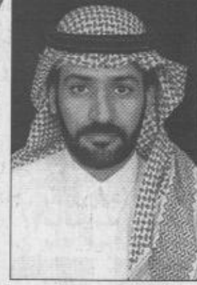
ب/قلم / سدي الروقي

بكل الحب والولاء استقبلت الشرقية أبنا متعب فماثلت الأمواج رذاذها وتبست الرمال عجاجها وورودها هكذا وبدون مقدمات فهدالله شقيق الفهد وعبيده والفهد خادم الحرمين الشريفين وناصر الإسلام والمستضعفين وهذا هو عبدالله احتضنته الشرقية فاخذ ينثر كميرات الخير فيدشن المصانع ويضع اللبنات الأولى لمشروعات أخرى.. كل ذلك من أجل اسماء وزفاهية المواطن وهذه الراهبية كانت الشغل الشاغل لهذه الحكومة الفقيه هذا عبدالله شقيق الفهد يبدأ بيد وجنبا إلى