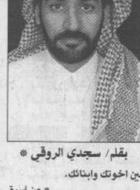
ب/قلم / سديدي الروقي