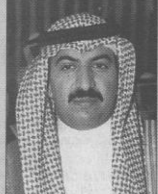
ب/قلم / ناصر سلمان الدخيم

إن زيارة صاحب السمو الملكي الأمير عبدالله بن عبدالعزيز للمنطقة الشرقية زيارة خير فتدشين هذه المصانع في الجبيل ورأس تنورة وغزلان جميعها أتت لراحة المواطن وليعيش في رغد من العيش وستجني أن شاء الله الأجيال القادمة ثمرة هذه المشاريع المعلاقة وأضاف الدخيم: أنه رغم الظروف الاقتصادية غير المستقرة التي يعيشها العالم بأسره إلا أننا هنا في المملكة العربية السعودية مازلنا نبني عندما توقف الآخرون وجعلهم يعيدون حساباتهم وذلك بفضل الله تعالى ثم بفضل التخطيط الجيد والخطة المدروسة التي أتت ثمارها الآن وغداً إن شاء الله.. وأردف الدخيم بأن هذا الحب الكبير الذي يكنه هذا الشعب لهذه القيادة تابع مما تكنه هذه القيادة لهذا الشعب واستشهد الدخيم بخطاب صاحب السمو الملكي الأمير عبدالله بن عبدالعزيز في حفل الأهل والأذي عبر فيه عن هذه المحبة بقوله «أنتم قرة العين» مدير مكتب مدير فرع مصلحة مياه الصرف الصحي بالقنفذ