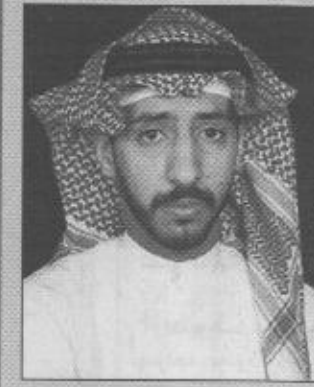
ب/قلم / صالح بن ناصر العيد

لم تكن زيارة صاحب السمو الملكي الأمير عبد الله بن عبدالعزيز في العهد نائب رئيس مجلس الوزراء ورئيس الحرس الوطني يحفظه الله للمنطقة الشرقية تشريفاً لهذه المنطقة فحسب بل كانت تشريفاً لجميع مناطق المملكة ومحافظاتها.. كل زيارة يقوم بها سموه الكريم لأي من مناطق ومحافظات المملكة إلا ويصحبها افتتاح أو إنشاء أو وضع حجر أساس لمشروع التنمية التي تزدهر بها مملكتنا الغالية ولأن هذه المشاريع لا تقتصر على المنطقة التي يزورها سموه الكريم بل تمتد الاستفادة منها إلى كافة مناطق المملكة ويستفيد منها كل مواطن ومقيم على أرض هذا التراب الطاهر.