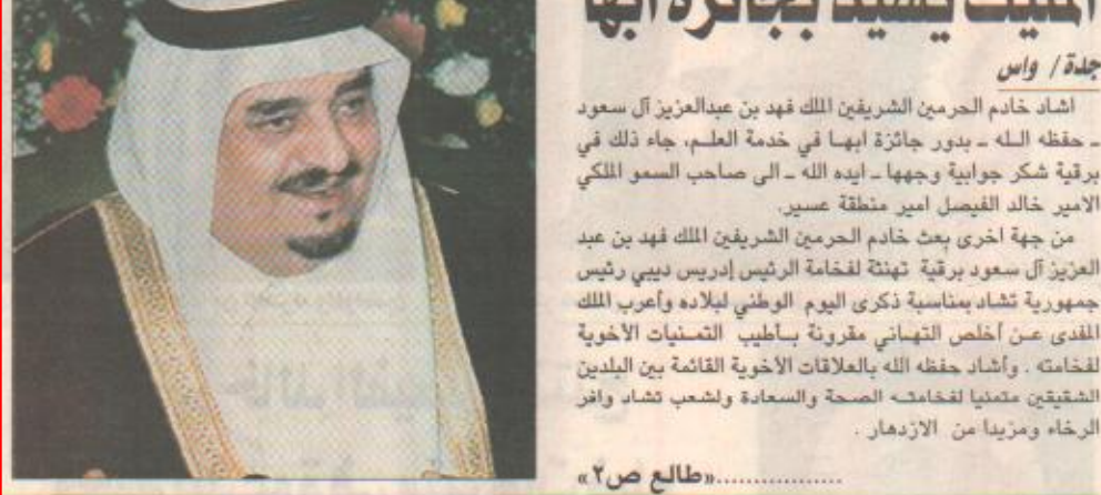
اشاد خادم الحرمين الشريفين الملك فهد بن عبدالعزيز آل سعود - حفظه الله - بطور جائزة أباها في خدمة العلم، جاء ذلك في برقية شكر جوابية وجهها - أبه الله - إلى صاحب السمو الملكي الأمير خالد الفيصل أمير منطقة عسير.