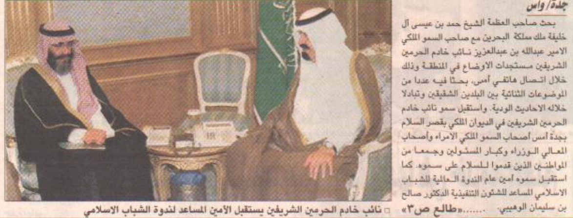
بحث صاحب العظمة الشيخ حمد بن عيسى آل خليفة ملك مملكة البحرين مع صاحب السمو الملكي الأمير عبدالله بن عبدالعزيز نائب خادم الحرمين الشريفين مستجدات الأوضاع في المنطقة وذلك خلال اتصال هاتفى أمس، بحثاً فيه عن عدد من الموضوعات الثنائية بين البلدين الشقيقين وتبادلًا خلاله الاحاديث الودية. واستقبل سمو نائب خادم الحرمين الشريفين في البوابة الملكى بقصر السلام بجدة أمس أصحاب السمو الملكي الأمراء وأصحاب المعالي الوزراء وكبار المسؤولين وجمعاً من المواطنين الذين قدموا للتسليم على سموه. كما استقبل سموه أمين عام الفتوى العمالية للشباب الاسلامى المساعد للشئون التنفيذية الدكتور صالح بن سليمان الوهيبي. «طالع ص ٣»