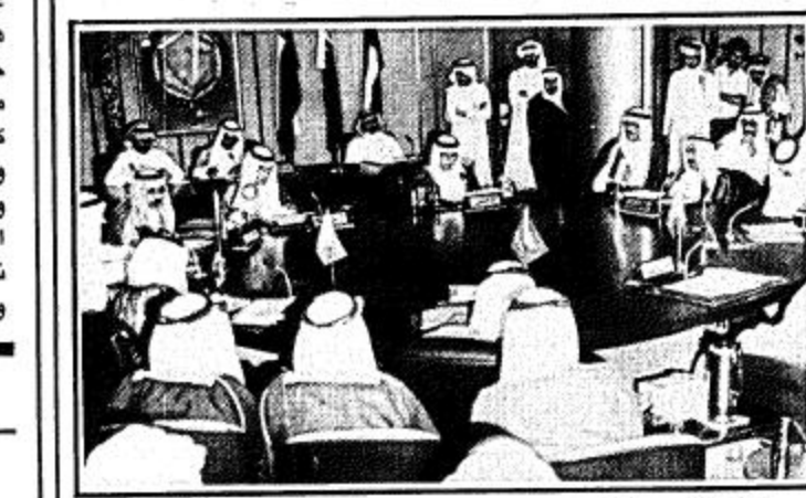
جانب من الجلسة الاخيرة لوزراء التجارة بدول المجلس التعاون

كتب: عبد الرزاق التونسي انتهى وزراء التجارة في دول مجلس التعاون الخليجي مؤتمرهم الاول مساء امس بالرياض بعد ان خرجوا بقرارات وتوصيات هامة بعد جلسات مغلقة. وقد وافق الوزراء في جلستهم الصباحية على تقرير وكلاء وزارات التجارة في اجتماعهم السابق بالكويت يوم ٢٦ مايو الماضي. وايضا الموافقة على ورقتي العمل السعودية المعروضة على المؤتمر حول الخطوط التنفيذية لبعض جوانب الاتفاقية الاقتصادية وحول انشاء جهاز موحد لاعمال التقنين في دول المجلس. وقد اقر المؤتمر تلك الورقتين ووافق عليها كما تمت الموافقة على تحويل الهيئة العربية السعودية للمواصفات والمقاييس الى هيئة خليجية وسيتم ربطها بالادارات الحكومية ذات العلاقة في كل دولة من دول المجلس. كما وافق وزراء التجارة على جميع المواضيع المطروحة على جدول الاعمال وتم تشكيل لجان للتعاون التجاري الى جانب تكليف الامانة العامة لدول المجلس لدعوة الغرف التجارية بهدف توضيح جوانب التنفيذ للاتفاقية الاقتصادية الخليجية الموحدة. [تفاصيل اخرى.. بالداخل]