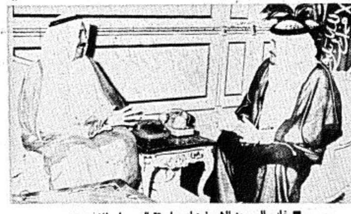
خادم الحرمين الشريفين لدى استقباله صباح الاحد

الجزائر / الرياض / واس - اعرب المكتب السياسي للجنة المركزية لحزب جبهة التحرير الوطني الجزائري عن تقديره الفائق لجهود الموفقة التي بذلها خادم الحرمين الشريفين الملك فهد بن عبدالعزيز آل سعود لاعادة السلم والوفاق في منطقة المغرب. وقد استعرض في اجتماعه الذي عقده امس برئاسة رئيس جمهورية الجزائر الديمقراطية الشعبية الشاذلي بن جديد نتائج القعة الثلاثة التي عقدت الاسبوع الماضي بين خادم الحرمين الشريفين والعالء المغربي الحسن الثاني والرئيس ابن جدييد. ومن جهة اخرى استقبل خادم الحرمين الشريفين الملك فهد بن عبدالعزيز آل سعود حفظه الله في مكتبه بالديوان الملكي مساء امس سمو الشيخ صباح الامد الصباح نائب رئيس مجلس الوزراء ووزير الخارجية بدولة الكويت الذي نقل لخادم الحرمين الشريفين رسالة من اخيه صاحب السمو الشيخ جابر الاحمد الصباح امير دولة الكويت الشقيقة. وقد حضر القايلة صاحب السمو الملكي الامير عبدالله بن عبدالعزيز ولي العهد ونائب رئيس مجلس الوزراء ورئيس الحرس الوطني وصاحب السمو الشيخ جابر الاحمد الصباح امير دولة الكويت الشقيقة. (البقية ص ١٨)