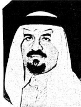
اللجنة الادارية التحضيرية للجنة العليا للاصلاح الاداري الدكتور محمد الطويل الزهراني

الرياض / واس - عقدت اللجنة العليا للاصلاح الاداري ظهر امس اجتمعا برئاسة صاحب السمو الملكي الامير سلطان بن عبدالعزيز النائب الثاني لرئيس مجلس الوزراء ووزير الدفاع والطيران والمفتش العام ونائب رئيس اللجنة العليا للاصلاح الاداري وذلك بمكتب سموه بالوزارة. وحضر الاجتماع معالي وزير المالية والاقتصاد الوطني الاستاذ محمد ابا الخيل ومعالي وزير التحويلات والثروة المعدنية ووزير التخطيط والتنمية الاستاذ هشام ناظر. كما حضر الاجتماع معالي وزير الدولة وعضو مجلس الوزراء الدكتور محمد المزمع ومعالي وزير الدولة وعضو مجلس الوزراء الاستاذ محمد ابراهيم مسعود ومعالي وزير الدولة وعضو مجلس الوزراء ورئيس الديوان العام للخدمة المدنية الاستاذ تركي خالد السديري ورئيس