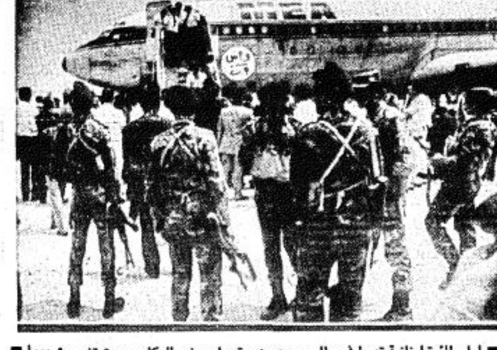
اول طائرة لبنانية تهبط في مطار بيروت وهي تحمل بعض الركاب بعد توقف ٩٠ يوما

بيروت - رويترز - اهب.. سقطت بضعة قذائف مدفعية على ميناء بيروت بالقرب من خطوط التماس الفاصلة بين القطاعين العربي والشرقي للعاصمة صباح امس بينما استأنف مبعوثون للرئيس امين الجميل محادثات سلام متوقفة منذ زمن طويل مع المسؤولين السوريين في دمشق. وقالت مصادر امينة ان اربع قذائف سقطت في ميناء بيروت وقذيفة خامسة في منطقة الاشرفية السكنية في بيروت الشرقية في حين اصابت قذيفة سادسة خزان مياه مدرسة مجاورة. ولم يبلغ عن وقوع اصابات. واضافت تقول ان رصاص قنص شديد اقل عبرا للضفة بين بيروت الشرقية وبيروت الغربية وهو واحد لثلاث معابر بين القطاعين. وجرى اطلاق القذائف المدفعية وهو الاول في بيروت هذا الشهر بعد ان بدأ ثلاثة مبعوثين من الرئيس الجميل محادثات في دمشق الليلة قبل الماضية حول املاحات سياسية تهدف الى اهاء الحرب الاهلية في لبنان التي مضى عليها ١٢ سنة. ولم يعلن شيء عن مدى تقدم المحادثات. وقالت صحف بيروت ان محادثات دمشق وهي الاولى منذ تعليق حوار سابق في ٢٨ اذار مارس الماضي يتوقع ايضا ان تشمل ازمة حكومية ناجمة عن استقالة السيد رشيد كرامي رئيس الوزراء اللبناني قبل اسبوع. واستأنف شركة طيران الشرق الاوسط اللبنانية رحلاتها العادية من والى مطار بيروت الدولي امس بعد توقف استمر ٩٠ يوما في اعقاب موافقة شركات التايمن على اعادة التايمن على ركاب الشركة. (البقية ص ١٨)