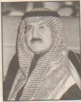
الأمير سطاتم بن عبدالعزيز

افتتح صاحب السمو الملكي الأمير سطاتم بن عبدالعزيز نائب أمير منطقة الرياض مساء أمس معرض الصور التاريخية الذي تنظمه مكتبة الملك فهد الوطنية بمناسبة اختيار الرياض عاصمة للثقافة العربية لعام 2000م وذلك بمقر المكتبة بالرياض.