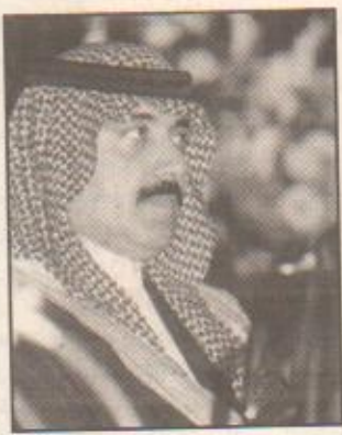
الأمير متعب بن عبد الله

وتوجيهه - حفظه الله - بتفعيل مشاركة دول المجلس في فعاليات المهرجان الوطني للتراث والثقافة بالجنادرية. ويحث سمو الأمير متعب بن عبد الله مع سفراء دول مجلس التعاون طبعاً مشاركة دول المجلس في المهرجان وما تطله من أهمية ومكانة كونها تجسد الترابط الكبير والعلاقات الوثيقة والثوابت المشتركة بين دول مجلس التعاون الخليجي.