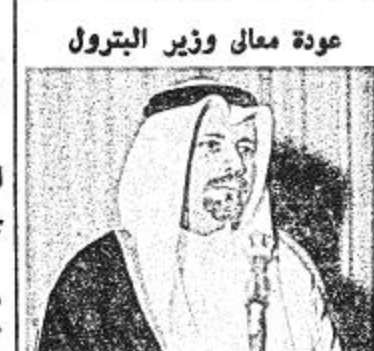
عودة معالي وزير البترول

السراعي في رفع الاسعار لصالح جميع دول العالم وصالح شعوب دول الأوابك ابو ظبي من حساند عطاس والوكالات وافق مجلس منظمة الاقطار العربية المصدرة للبترول « اوابك » في ختام اجتماعاته التي بدأها امس على اجراء دراسة الجدوى الاقتصادية التفصيلية لمشروع اقامة حوض جاف في احدى الدول العربية الاعضاء الملتمة على البحر المتوسط • وتنافس المجلس الامور المتعلقة بشأن معهد النفط العربي للتدريب ووافق على مشروع القرار الخاص بتحديد مهام واختصاصات مجلس الامناء والمدير العام للمعهد • كما ناقش الاسس المقترحة لسياسة عربية مشتركة للتدريب وفرو تشكيل لجنة على مستوى عال من المسؤولين لاستكمال دراستها وتقديم التوصيات المناسبة في هذا الشأن واطلع المجلس على نتائج البحوث التي تمت مسح السوق الاوربية المشتركة ووافق على وسبعمائة والثلث وستين الف دينار كويتي