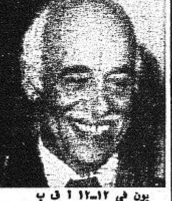
سيد مرعي يعود من اوسلو بعد تسلمه جائزة نوبل مناصفة

واشنطن - خاص بالجزيرة علمت الجزيرة من مصادر مطلعة ان المسؤولين الاميركيين يراقبون باهتمام بالغ تطوور الامور بين سوريا والاتحاد السوفيتي اثر الخلافات التي تشبت مؤخرا بين الدولتين حول