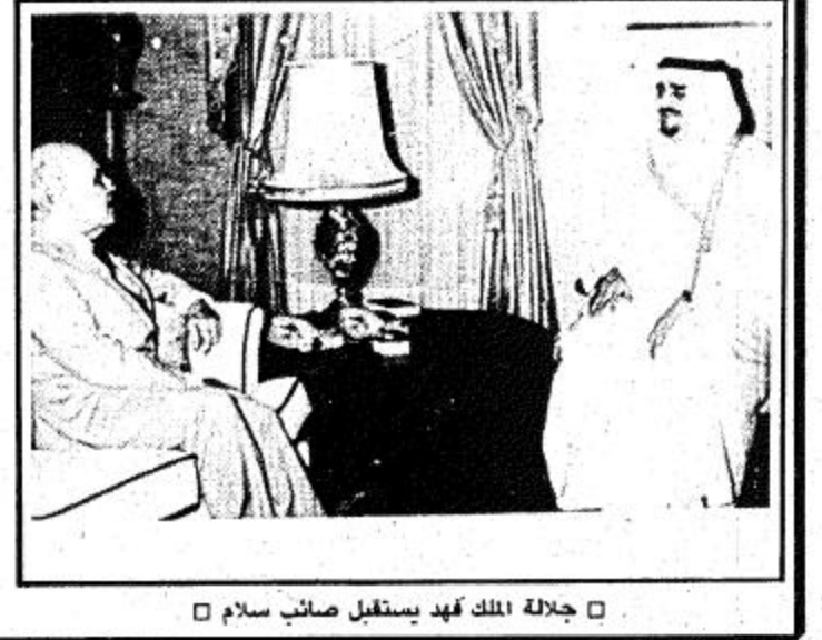
جلالة الملك فهد يستقبل صائب سلام