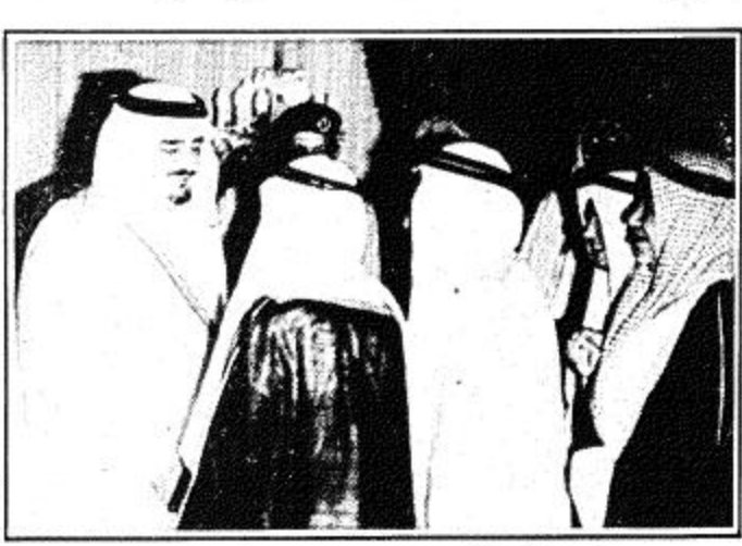
جلالة الملك يستقبل وجهاء مكة المكرمة وجدة

جدة - واس... استقبال جلالة الملك فهد بن عبد العزيز المفدى في الساعة الثانية والرابع من بعد ظهر اسر بالديوان الملكي بجدة وزير خارجية المغرب السيد محمد بوستة الذي سلم جلالة رسالة خلية من اخيه جلالة الملك الحسن الثاني. كما استقبل جلالاته ظهر امس بالديوان الملكي بجدة رئيس وزراء لبنان الاسبق السيد صائب سلام. وحض المقيمين صاحب السمو الملكي الامير عبد الله بن عبد العزيز وفي العهد ونائب رئيس مجلس الوزراء ورئيس الحرس الوطني. ومن ناحية اخرى بعث جلالة الملك فهد بن عبد العزيز المفدى ببرقية شكر جوابية لخماعة الرئيس الفنزويلي لويس هيريرا كامبيس ردا على برقية التهئة التي بعثها لجلالته بمناسبة اليوم الوطني للمملكة. وقد اعرب جلالة الملك فهد المفدى في برقيته عن خالص تمنياته للرئيس كامبيس بالصحة والهناء ولشعب فنزويلا الصديق بسلام والازدهار مؤكدا على تطور الوحدة والتعاون القائم بين البلدين في المستقبل.