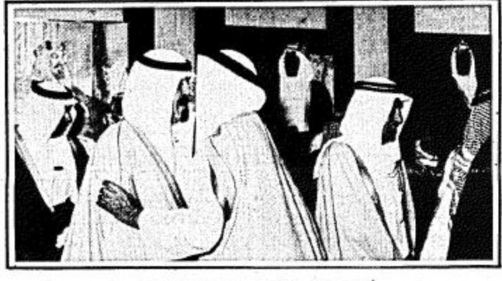
سمو ولي العهد يستقبل المواطنين

الرياض - واس - استقبل صاحب السمو الملكي الأمير عبدالله بن عبد العزيز ولي العهد ونائب رئيس مجلس الوزراء ورئيس الحرس الوطني بمكتبه بمبنى رئاسة الحرس الوطني قبل ظهر أمس عدداً من اصحاب السمو الامراء وكبار المسؤولين ورئيس هيئة الأركان العامة الفريق اول ركن محمد صالح الحامد وعدداً من كبار قادة وضباط القوات المسلحة وقادة وضباط الحرس الوطني وجمعا من المواطنين.. وقد تشرّف الجميع بالسلام على سموه وتهنئته بسلامة الوصول وبالعام الهجري الجديد..