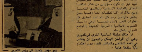
• سمو امير يبحث الى رئيس التصوي

هناك قوى طريق واحد هو العربي •• لقد بدأ انهم انهم باسم الاثبات وزرع امرائهم الجهود السلبية ولكن اسرائيل تمنعها اعزازها على احتلال الاراضي المأثورة فقد سببت فشل جهود التذكير كيميبي ، وبالتالي فانها وهدمها قانونيا عن نتائج فشل المصل ذلك ان صمود جديده ان وقت في الشرق الايسران لا تكون محصورة الاثر ابداء ورحماني منها العالي كله •• نتر بوضوح ان بعض رجال العرس الوطني يتدبرون على البلاغ من اباد البيروك فيما لو تعرضت لاي غزو مما سبق سنة ١٩٤٠ ••