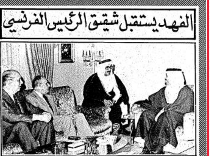
لقطة من جلسة افتتاح القمة الخليجية

الفهد يستقبل شقيق الرئيس الفرنسي واصل السيد جاك ميتران مبعوث الرئيس الفرنسي فرانسوا ميتران نشاطه أمس بزيارة نائب جلالة الملك المعظم صاحب السمو الملكي الأمير فهد بن عبد العزيز ولي العهد.. ونائب رئيس مجلس الوزراء. وقد شهد اللقاء صاحب السمو الملكي الأمير عبد الله بن عبد العزيز النائب الثاني لرئيس مجلس الوزراء ورئيس الحرس الوطني. ومبعوث الرئيس الفرنسي كما أشارت الجزيرة هو أيضا رئيس الشركة الفرنسية للنفط وهي التي قد تشارك مع الدول العربية في عملية القمر الصناعي العربي. وعلى نطاق آخر.. فإن الفهد استقبل في منتصف يوم أمس السيد خوان أنطونيو مازيسا وزير الاقتصاد والتجارة الإسباني الذي يزور المملكة. وكان يصحبه معالي الدكتور سليمان السليم وزير التجارة.