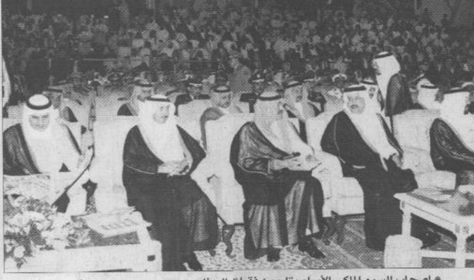
أصحاب السمو الملكي الأمراء يتابعون فقرات الحفل