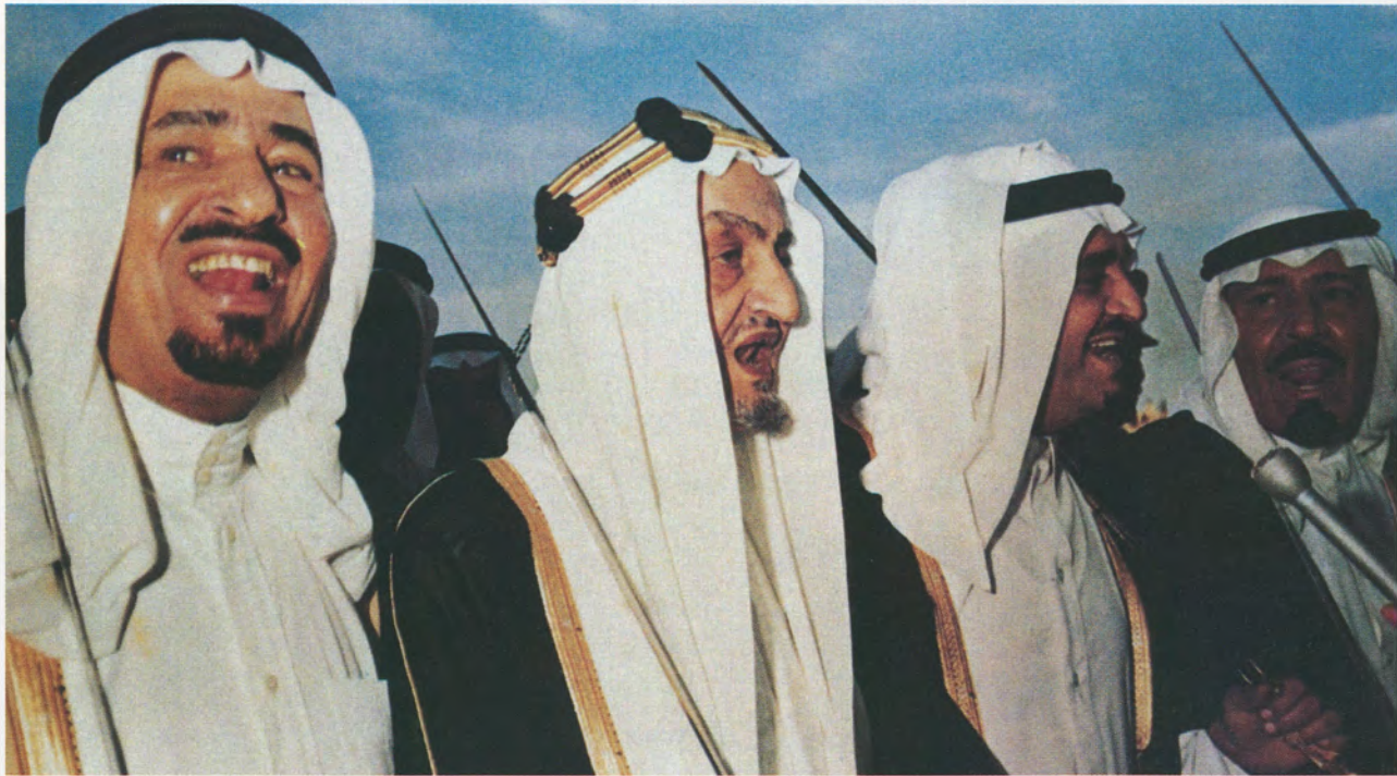
يؤدي العرضة مع اخوانه والملوك السابقين.