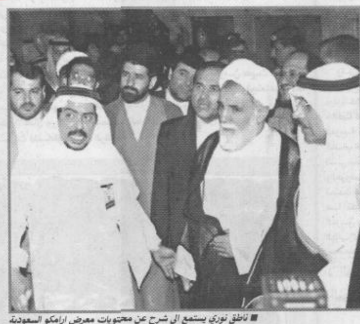
ناطق نوري يستمع الى شرح عن محتويات معرض أرامكو السعودية...