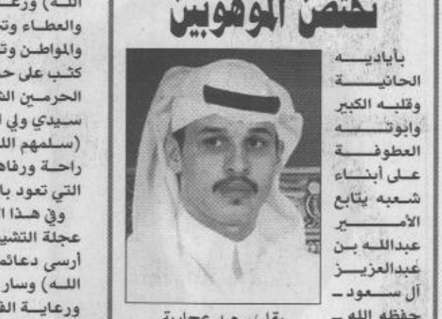
ب/قلم / سعيد عجاجية

التقدم في كافة المجالات لتحقيق الازدهار والرفاهية لابناء المنطقة الشرقية ولان المملكة تؤمن بالحاضر وتتطلع للمستقبل فقد بدأت تتوجه الى احتضان الاجيال الجديدة برفاعة اكبر كونهم رجال الفد وصناع المستقبل الذين سوف يتحملون على المدى القريب مسئوليات بناء وطن تتوافر فيه كل عناصر التطور العلمي والتكنولوجي والرقمي المدني والعمراني. ومؤسسة رعاية الموهوبين التي وضع حجر الاساس لها ولي العهد الامين يوم الاثنين الماضي هي احدى الدعائم التي يبني عليها مستقبل الاجيال القادمة وهو التوجه الذي تأخذ به كل الدول المتقدمة وهو دليل واضح على وجود رغبة جادة بتفعيل النظرة المستقبلية لى ولاة الامر في هذا الوطن للتخول في احسان مع الزمن كي تلحق بقطار التفوق والتقدم العلمي الذي يتسابق العالم للوصول اليه. ان رعاية الاجيال الجديدة بطرق علمية وتربوية تستهدف اول ماتستهدف رعاية الموهوبين واتاحة الفرص لهم ليحققوا التفوق في شتى المجالات والاخذ بكل اسباب المعصر. ان المملكة حريصة أشد الحرص على التواصل بين الاجيال ولها نظرة بعيدة في التطلع لمستقبل أفضل. ان ولي العهد برعايته الكريمة للموهوبين يعطي نموذجاً للقيادة الحكيمة والواعية التي تتطلع لارتقاء بالوطن والمواطن.