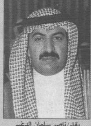
ب/قلم / ناصر سلمان الدخيم

إن زيارة صاحب السمو الملكي الامير عبدالله بن عبدالعزيز للمنطقة الشرقية زيارة خير فتدشين هذه المصانع في الجبيل وراس تنورة وغزلان جميعها أتت لراحة المواطن وليعيش في رغد من العيش وستجني ان شاء الله الاجيال القادمة ثمرة هذه المشاريع المعلاقة وأضاف الدخيم: أنه رغم الظروف