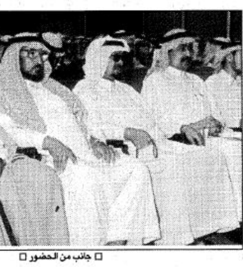
□ جانب من الحضور □

□ الشاعر يتسلم درعاً تذكارية □