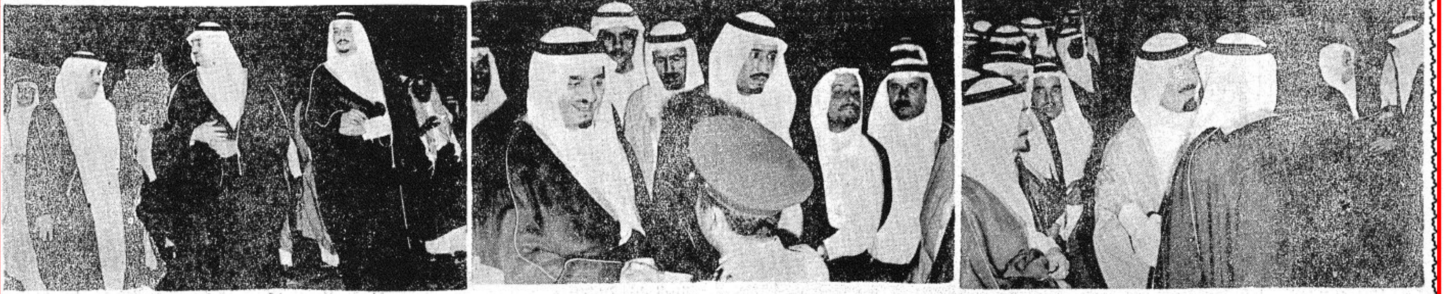
شريف من جوانب الاستقبال الكبير لسمو الامير فهد بن عبد العزيز النائب الثاني لرئيس مجلس الوزراء وزير الداخلية اثر عودته الى الرياض يوم امس