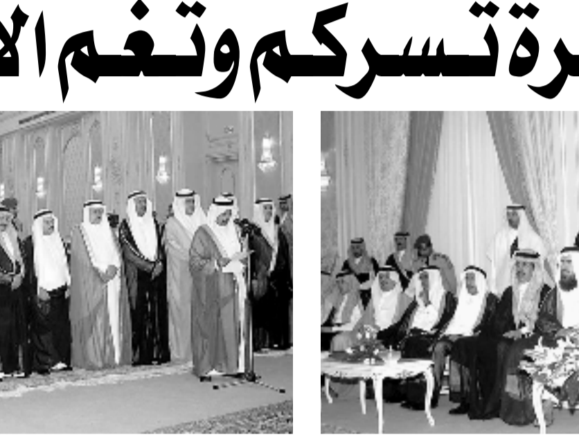
سمو ولي العهد لدى استقباله الامراء وكبار المسؤولين وجمعا من المواطنين ووفدا من قبيلتي الخماعة والحمارة في جدة امس

فيكم شك ولا في أخلاقكم وحميتكم ووطنيتكم ما فيها شك نحو دينكم ووطنكم وحكومتم. واكد سمو ولي العهد ان الفتنة الضالة مدحورة في الداخل والخارج باذن الله وقال سموه: هؤلاء فتنة ضالة.. فتنة مع الاسف يستغرب عليكم اذا بذلت جهنم لخدمة دينكم ووطنكم لان الوطن بدون دين لا شيء.. وانتم والشعب السعودي كله بدون هذه العقيدة الاسلامية لا شيء.. واصاف سموه قائلا: انتم أهل النخوة وأهل الحمية وأهل الوفاء.. ولا