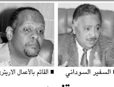
السفير السوداني القائم بالأعمال الابريري

الرياض - اليوم تستضيف إذاعة القرآن الكريم عصر اليوم عبر حلقة في البرنامج الأسبوعي (معكم على الهواء) فضيلة الشيخ سعد بن سعيد الحجري ليتحدث خلاله حول (الوصايا القيمة لطالب العلم)