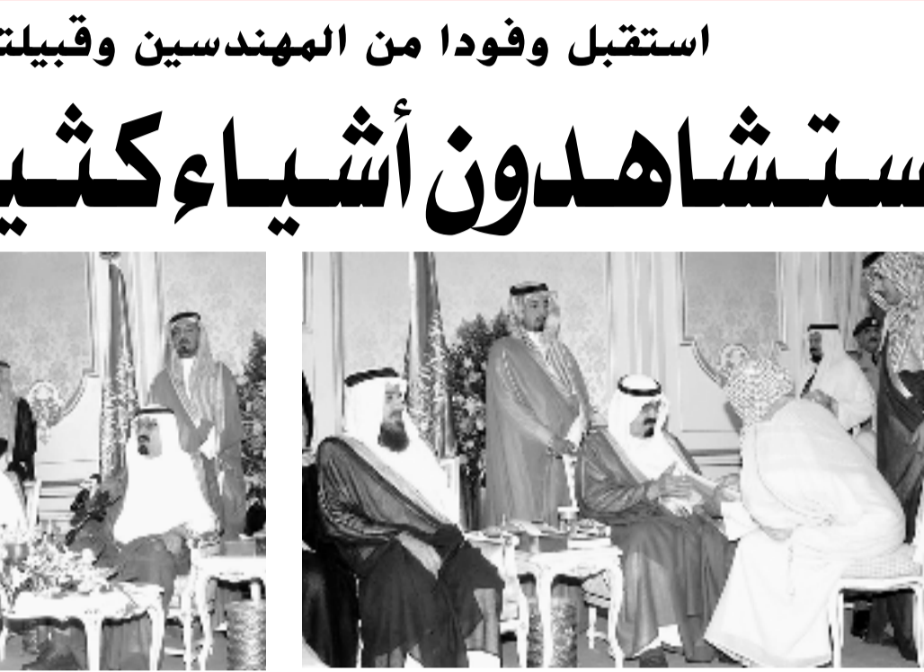
سمو ولي العهد لدى استقباله الامراء وكبار المسؤولين وجمعا من المواطنين ووفدا من قبيلتي الخماعة والحمارة في جدة امس

صاحب السمو الملكي الامير عبدالله بن عبدالعزيز عن شركه لهم مؤكدا سموه في الجمع. وقال سموه: انتم ولله الحمد ايايكم بيض.. انتم تعمرون ولا تهدمون وهذا البلد بلدكم وبلد ابايكم وأجدادكم.. ولا يستغرب عليكم اذا بذلت جهنم لخدمة دينكم ووطنكم لان الوطن بدون دين لا شيء.. وانتم والشعب السعودي كله بدون هذه العقيدة الاسلامية لا شيء.. واصاف سموه قائلا: انتم أهل النخوة وأهل الحمية وأهل الوفاء.. ولا