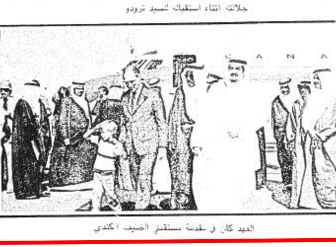
الملك كاد في لحظة استقبال السيد كندى