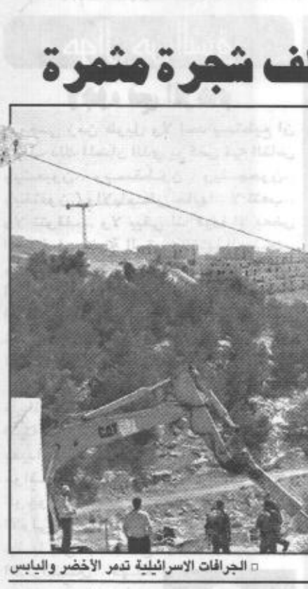
الجرافات الإسرائيلية تدمر الأخضر والياباس