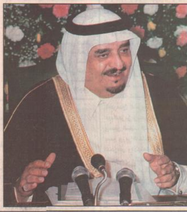
مكة المكرمة/ عبد العزيز الجنيبي صدر امر خادم الحرمين الشريفين الملك فهد بن عبدالعزيز - يحفظه الله - رقم ١٢٠٢/م وتاريخ ١٤٢١/٩/٢٤هـ بتشكيل هيئة عليا لتطوير مكة المكرمة برئاسة صاحب السمو الملكي أمير منطقة مكة المكرمة وعضوية كل من فضيلة الشيخ صالح بن حميد امام وخطيب المسجد الحرام وعضو مجلس الشورى وفضيلة رئيس محكمة التمييز بمكة المكرمة ومعالي أمين العاصمة المقدسة ووكلاء وزارات الأشغال العامة والإسكان والشؤون الإسلامية والأوقاف والدعوة والإرشاد والحج والمالية والاقتصاد الوطني والمواصلات والشؤون البلدية والقروية ووكيل امانة منطقة مكة المكرمة وذلك لتقوم بوضع خطة عمل عاجلة لتطوير جميع المناطق القريبة من الحرم التي لم يتم تنظيهاها والسعي لاكمال الخطوط الدائرية وتطوير الساحات القريبة من الحرم

تكاليف المشروع تبلغ ٦٠٠٠ مليون ريال مكة المكرمة/ واس قام صاحب السمو الملكي الأمير عبدالله بن عبدالعزيز ولي العهد ونائب رئيس مجلس الوزراء ورئيس الحرس الوطني مساء أمس بزيارة للمعرض التابع لشركة مكة للتطوير والتعمير الذي يشتمل على عدد من المحطات لبناء المرحلة الثانية من مشروع تطوير المناطق المحيطة بالمسجد الحرام (منطقة جبل عمر) الذي ستنفذه الشركة على مساحة ٢٣٣٠ و ٠٠٠ بتكلفة إجمالية تقدر بنحو ٦٠٠٠ و ٠٠٠ ريال. ولدى وصول صاحب السمو الملكي الأمير عبدالله بن عبدالعزيز إلى مقر المعرض صاحبه سموه الملكي الأمير نواف بن عبدالعزيز وصاحب السمو الملكي الأمير فواز بن عبدالعزيز أمير منطقة مكة المكرمة