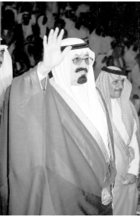
الأمير عبدالله بن عبدالعزيز