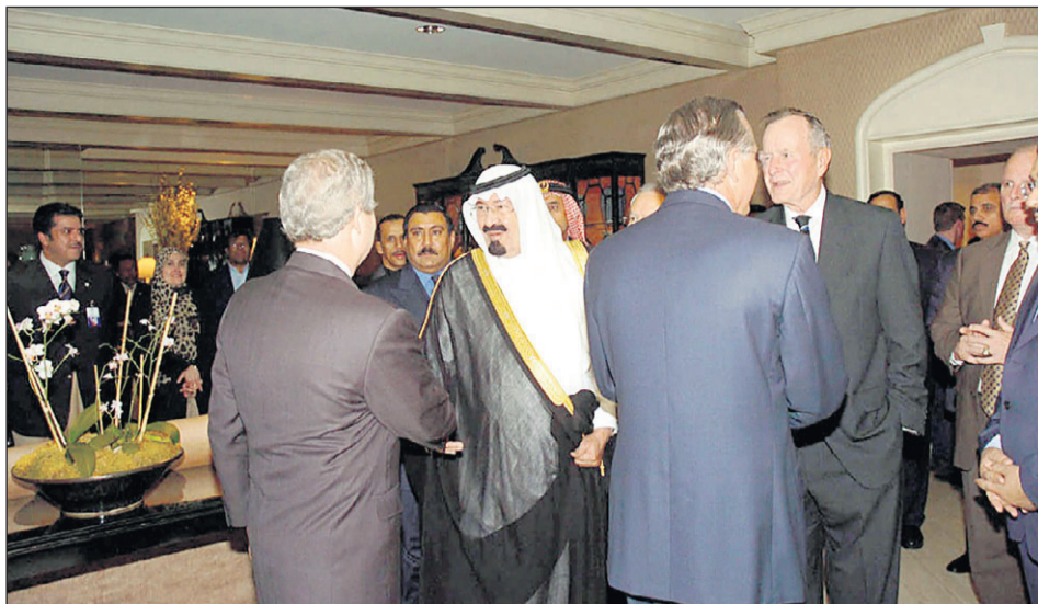
سمو ولي العهد وبوش الأب يستقبلان أعضاء في الحكومة