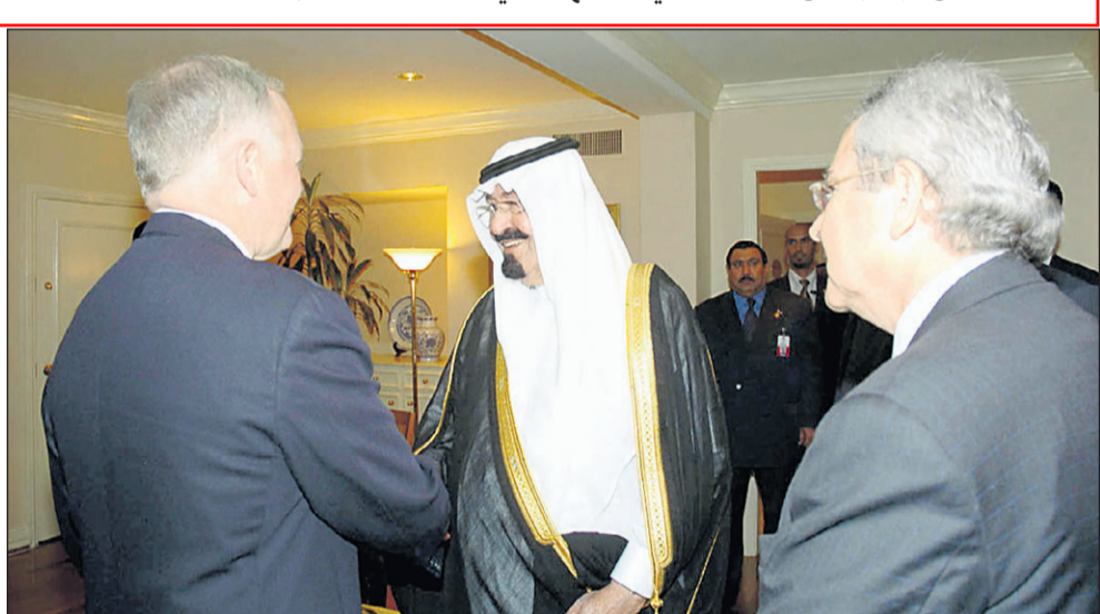
سمو ولي العهد يستقبل رئيس شركة هنت للبتترول

استقبل رئيس شركة هنت للبتترول.. ولي العهد على مأدبة عشاء بوش الأب: