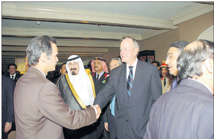
سمو ولي العهد وبوش الأب يصفان المستقبلين

يقول: إذا اعتقد المستهلكون أن الاجتماع سوف يحدث تراجعاً في أسعار البترين فإن الإجابة هي لا. وبشأن الموضوعات الأخرى التي أثيرت في الاجتماع قال مسؤولون إن الجانبين ربما اقتربا من التوصل لاتفاق بشأن تخفيضات التعريفات الجمركية التي يتعين على السعودية أن تقوم بها للانضمام إلى منظمة التجارة العالمية. ويعمل مفاوضون تجاريون أمريكيون وسعوديون على مدار الساعة للانتهاء من اتفاقية ثنائية بشأن بنود انضمام الرياض إلى منظمة التجارة العالمية. كما أثار بوش موضوع الديمقراطية في الشرق الأوسط في المحادثات. وكانت المملكة قد أجرت في الآونة الأخيرة أول انتخابات على مستوى البلاد لأعضاء المجلس البلدية، وهذه هي المرة الثانية خلال رئاسته التي يرحب فيها بوش بالأمير عبد الله في مزرعته في كروفورد، وتبرز هذه الدعوة الأهمية التي يعلقها بوش على التحالف مع المملكة التي تعد الدولة الأولى في تصدير النفط على مستوى العالم والعضو البارز في منظمة دول المصدر للنفط (أوبك). ويأتي اجتماع الأمير عبد الله مع بوش في مزرعته بعد أسبوعين من زيارة رئيس الوزراء الإسرائيلي إرييل شارون التي حذر بوش خلالها شارون من توسيع المستوطنات في الضفة الغربية. وفي عام 2002 طرح الأمير عبد الله اقتراحاً لإنهاء العنف في الشرق الأوسط بدعوة الدول العربية لتطبيق العلاقات مع إسرائيل في مقابل الانسحاب من الأراضي العربية المحتلة في حرب 1967. ورفضت إسرائيل فكرة الانسحاب الكامل. وينتظر أن يطرح الأمير عبد الله على بوش أن يكون ذلك الاقتراح جزءاً من خارطة الطريق.