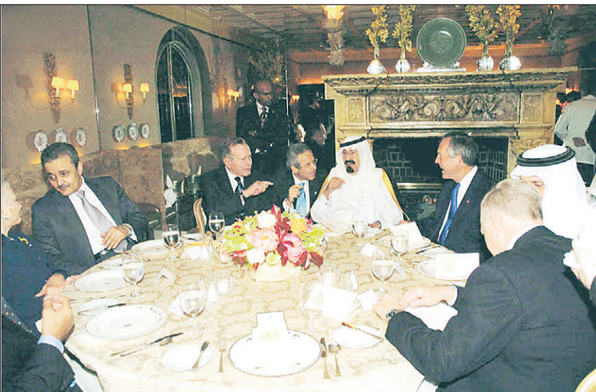
سمو ولي العهد وبوش الأب يصفان المستقبلين