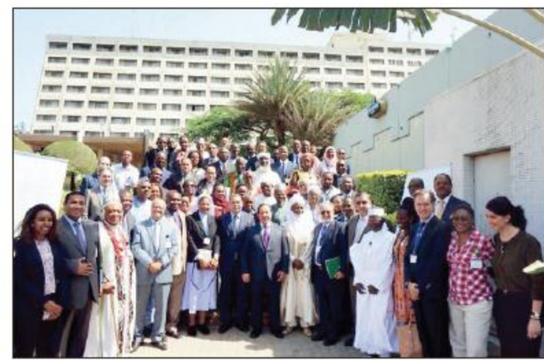
صورة جماعية للحوار

الاتحاد الأفريقي، ممثلين عن كافة أتباع الأديان في أفريقيا إلى جانب ممثلي المنظمات والعلماء والنساء والشباب.