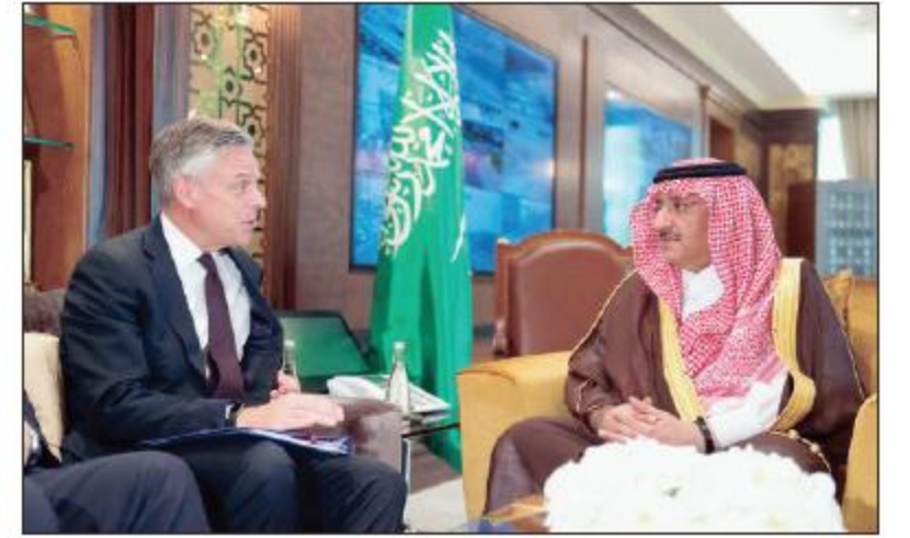
ولي العهد خلال استقباله جون هانتسمان