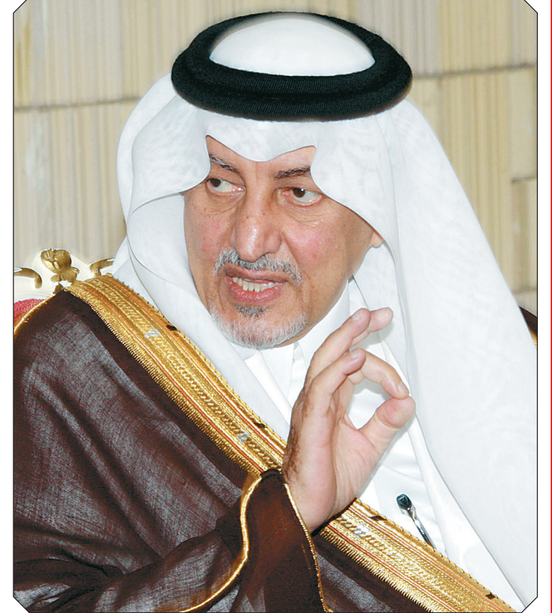
أمير منطقة مكة المكرمة متحدثاً للضيوف.