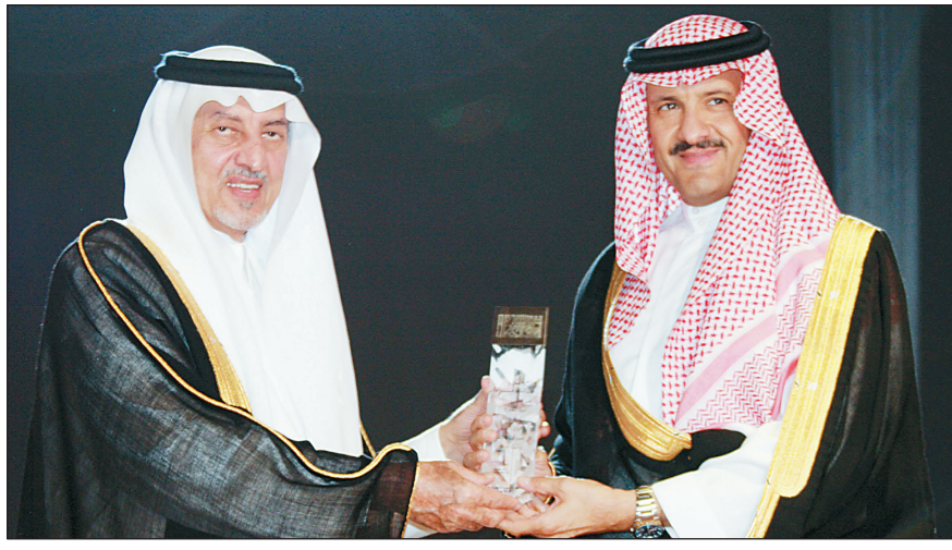
ويكرم الأمير سلطان بن سلمان الرئيس العام لهيئة السياحة والآثار.