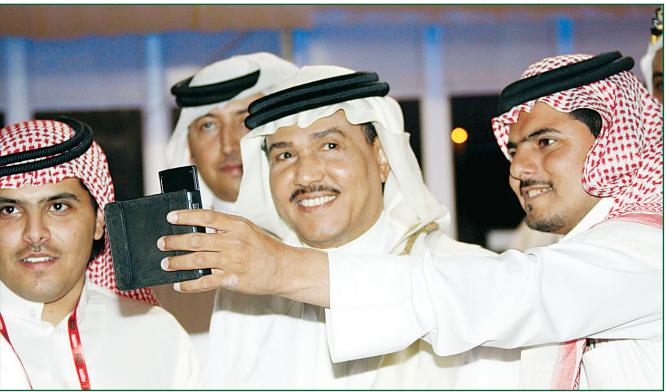
الفنان محمد عبده محاطاً بجمهوره بعد أدائه أنشودة عكاظ في المهرجان.

وعبر أمير منطقة مكة المكرمة عن أمله في أن يتطور مشروع سوق عكاظ ليكون مركزاً ثقافياً فكرياً ليس لإنسان هذه المملكة وإنما للإنسان العربي أينما كان، كما أتمنى أن تنتقل أنشطته لتصل إلى جميع أقطار العالم ليعروا ما بدأه