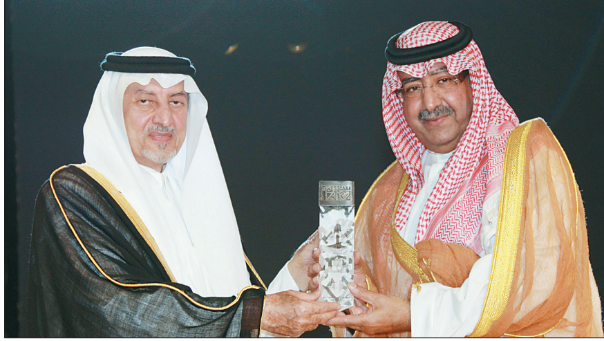
الأمير خالد الفيصل يكرم الأمير فيصل بن عبد الله وزير التربية والتعليم.

وقال أمير المنطقة: إن فكرة بروح سوق عكاظ ليس في المبنى ولا في وسيلة النقل، ولا يستعاد السوق بيت الشعر والخيل والجمال وإنما باحتضان