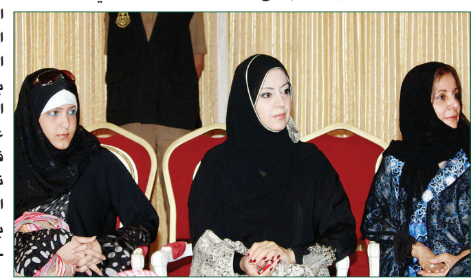
جانب من الحضور النسائي في الاحتفائية.

ونوه إلى أن الغرض من مدينة سوق عكاظ أن تؤدي ما نريده من إمكانيات يستخدمها الإنسان العربي المبدع في نقل صورة تمثل أصالة تاريخنا وإبداع