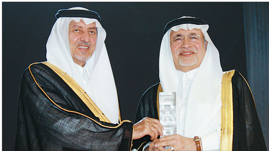
ويكرم وزير الثقافة والإعلام د. عبد العزيز خوجة.

عصرنا، فلدنيا العقل والإنسان المثقف ولدنيا القدرة المالية التي تحقق ما نريد في أقصر وقت ممكن. وطالب الأمير خالد الفيصل الجميع بتقديم مقترحات تساعد في إعطاء مشروع سوق عكاظ حقه من الاهتمام والإلتقان والتنفيذ.