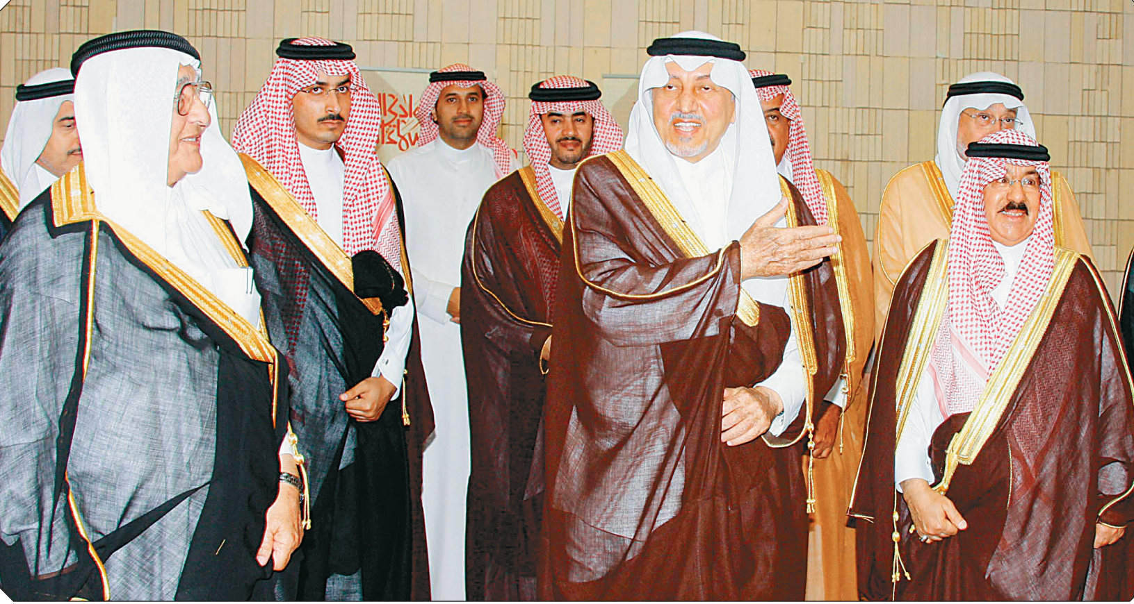
الأمير خالد الفيصل محتفياً أمس في الطائف بضيوف مهرجان سوق عكاظ.