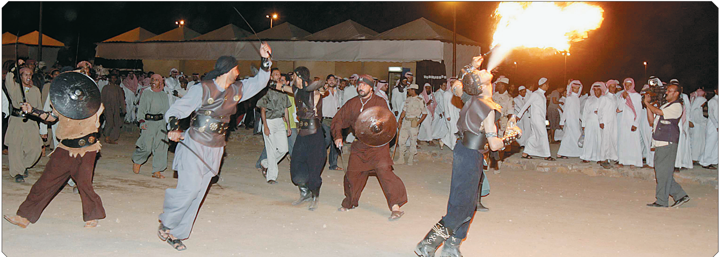
ممثلون يؤدون مشهداً درامياً في حفل افتتاح سوق عكاظ في الطائف البارحة الأولى.