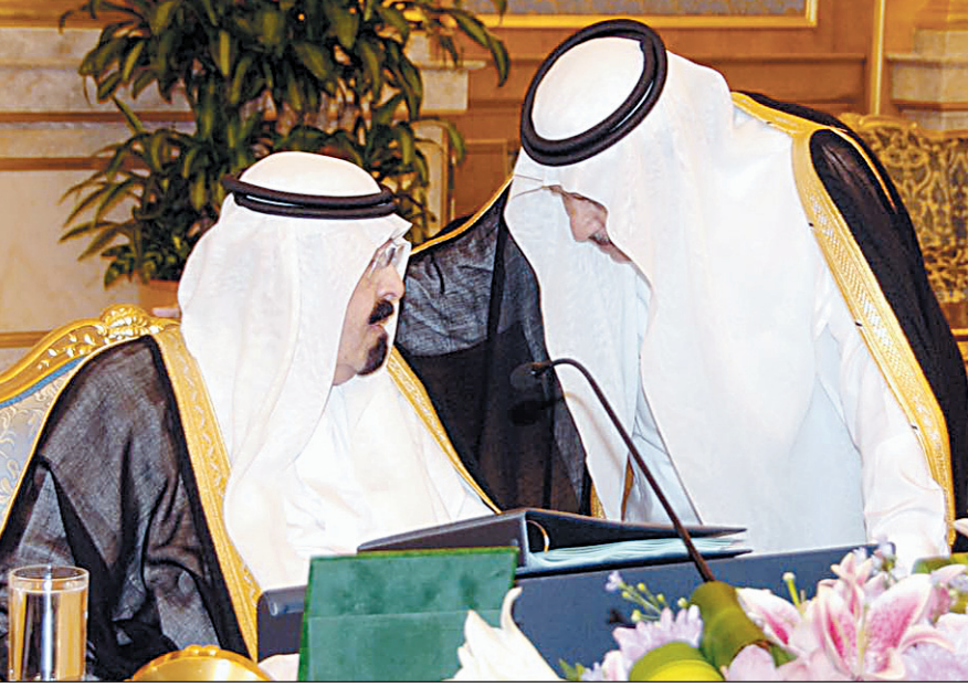
الملك والنائب الثاني في مجلس الوزراء أمس في جدة.