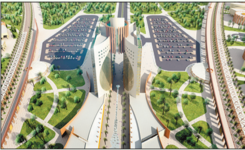
رسم ثلاثي الأبعاد لجامعة تبوك.