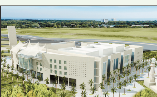
.. وآخر لجامعة الباحة.