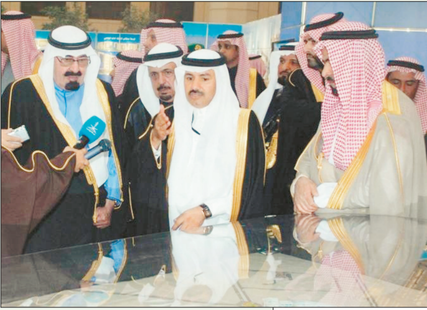
خادم الحرمين مطلعاً على أحد مشاريع وزارة التعليم العالي.