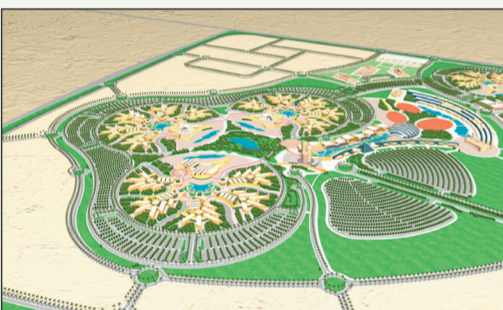
.. ومجمع آخر لجامعة الطائف.