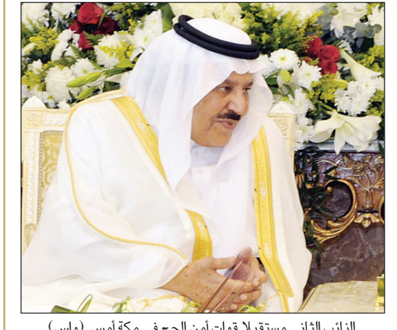
النائب الثاني مستقبلاً قوات أمن الحج في مكة أمس. (واس)