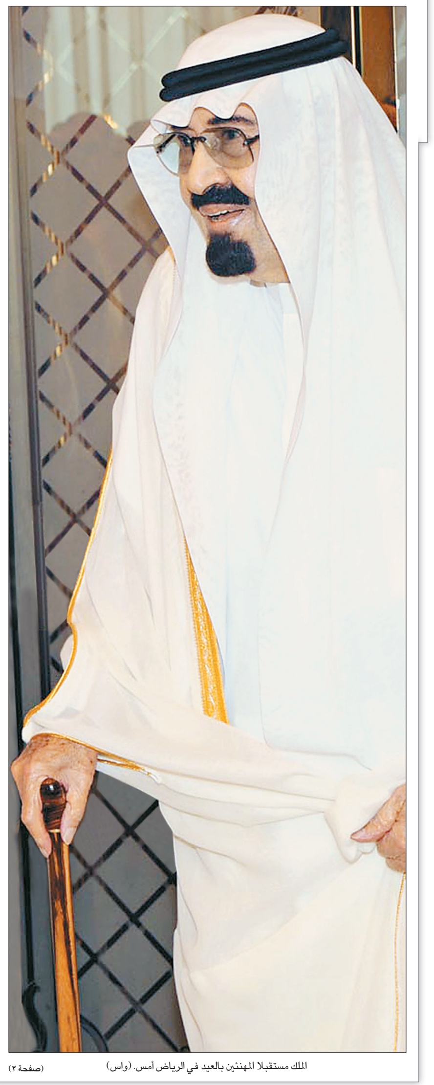
الملك مستقبلاً المهنيين بالعيد في الرياض أمس.

إخواني: أشكركم وأرجو لكم التوفيق، وأشكر كل فرد من الشعب السعودي سأل عني، ولله الحمد أنا بخير وصحة ما دمتم بخير. إخواني: جاءني هذه الوعكة ما أدري ما هي، ناس يقولون لها انزلاق وناس يقولون لها عرق النساء. النساء ما شفتنا منهن إلا كل خير، والعرق هذا من أين جاءنا، هذا عرق فاسد. ولكن إن شاء الله إنكم ما تشوفون إلا كل خير. أتمنى لكم التوفيق وأشكر كل من سأل عني، القاضي والداني، وعلى رأسهم الشعب السعودي الكريم، وأتمنى لكم التوفيق، وأرجوكم سامحوني لأنني ما قمت، بل صافحتكم وشكرا لكم.