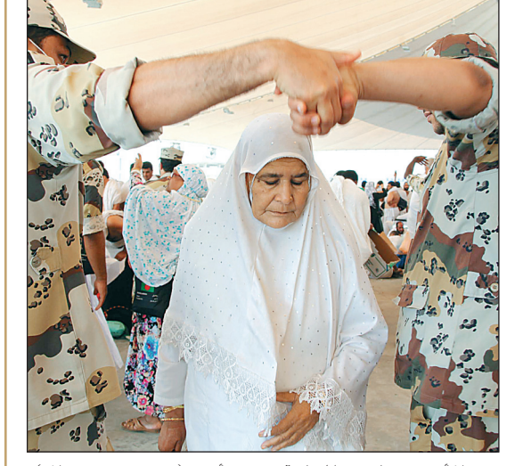
رجلا أمن يفتحان ممرا لحاجة في منى أمس.