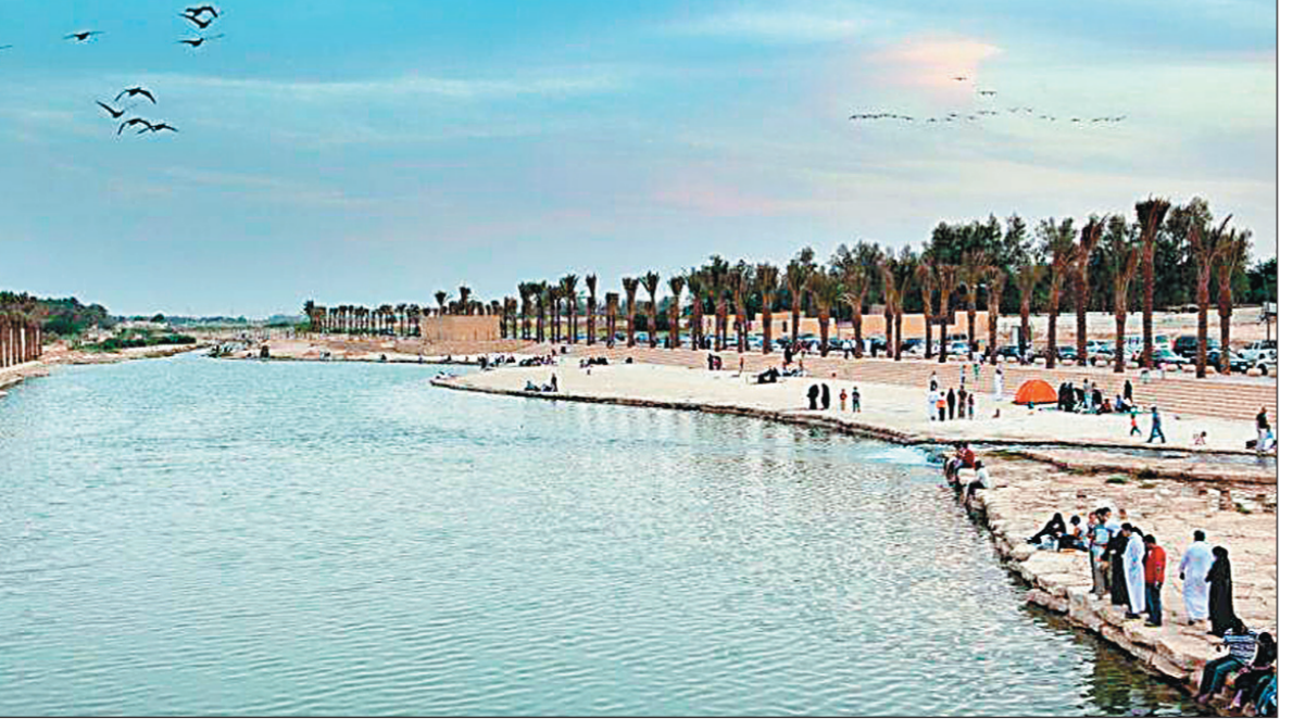
جانب من وادي حنيفة بعد تأهيله وتوظيفه كإحدى المناطق المفتوحة لسكان مدينة الرياض.