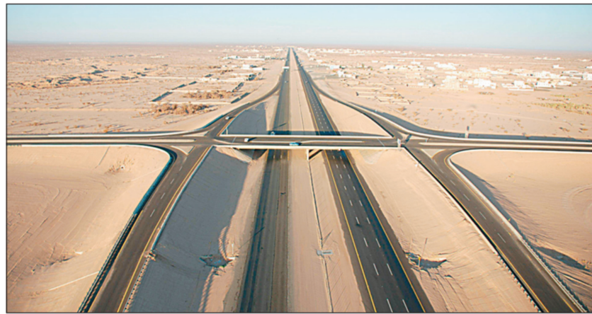
صورة جوية لطريق الطائف - الرياض ويتضح تأثير الشاحنات على طبقة الأسفلت في الجهة اليسرى للطريق.

وحول محطة الميزان الجديدة التي انتهت أعمال إنشائها بالقرب من جسر الخزرة على طريق الطائف - الرياض المتجه لمحافظة الطائف، أوضح الحسيني بأنها في طور التجهيز وسيتم تشغيلها قريباً.