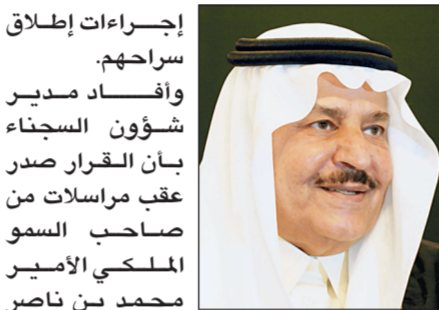
الأمير نايف بن عبد العزيز

التوجيهات تقتصر على السجناء في منطقة جازان مهما كان وصف الجرم، حيث سيتم أخذ التعهد على السجناء السعوديين، بينما يتم ترحيل الوافدين إلى بلادهم. وأتم مدير شؤون السجناء في إمارة منطقة جازان إلى محمد بن ناصر بن عبد العزيز أمير منطقة جازان، من التوجيه لم شمل السجناء بأسرهم.