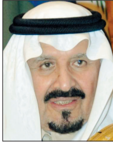
نائب خادم الحرمين الشريفين

وكان خادم الحرمين الشريفين وصل نيويورك فجر أمس الأول، لإجراء بعض الفحوصات الطبية بناء على توصية الأطباء إثر تعرضه لانزلاق غضروفي، وطمان نائب الملك صاحب السمو الملكي الأمير سلطان بن عبد العزيز لدى استقباله رئيس هيئة الأركان العامة وقادة وضباط أفرع القوات المسلحة أمس الأول في الرياض الجميع على صحة خادم الحرمين، حيث قال مطمئناً «أحب أطمئن الإخوان على صحة خادم الحرمين الشريفين والفحوصات كلها على أحسن ما يمكن».