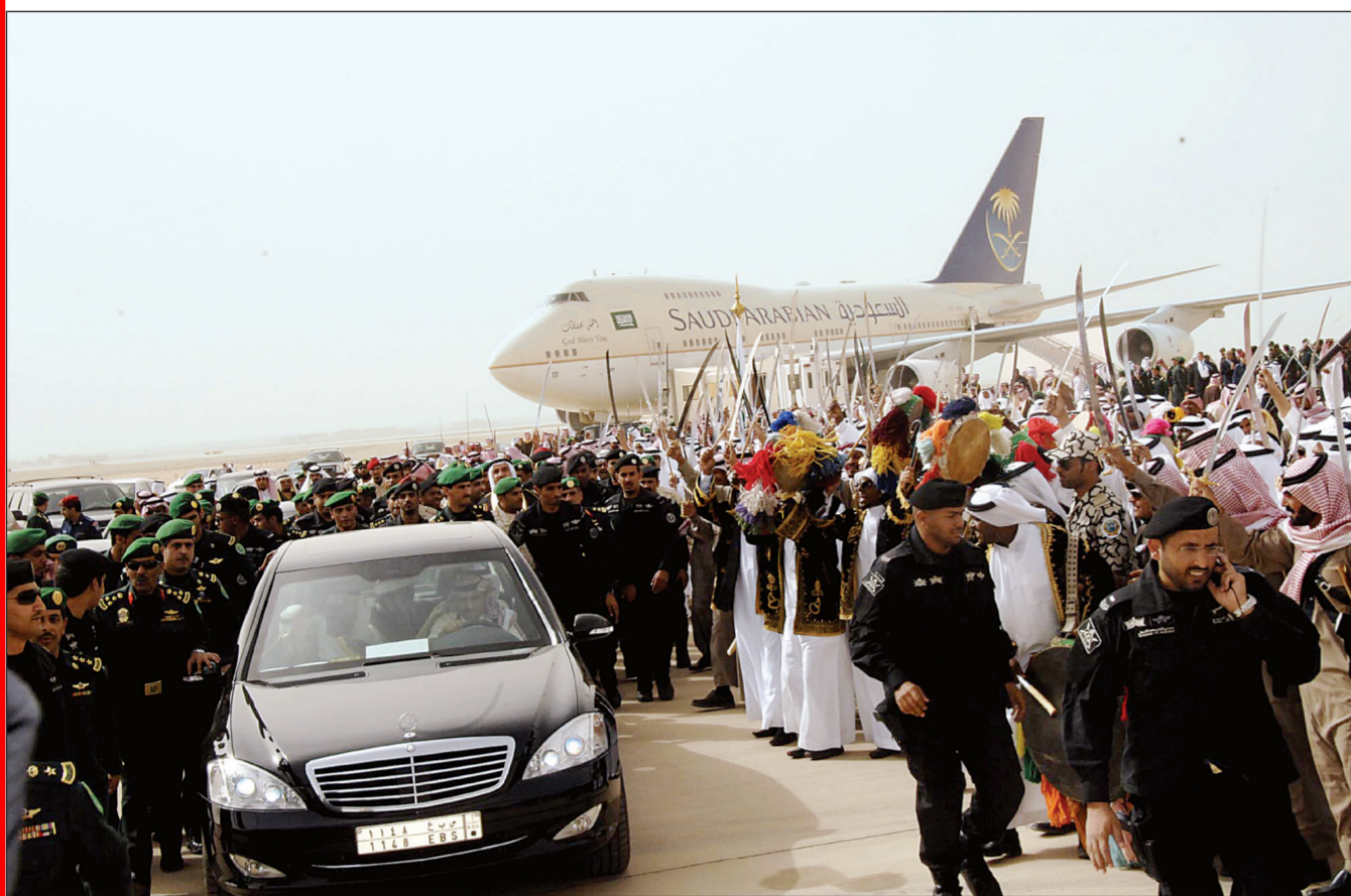
خادم الحرمين الشريفين مستقلا سيارته وسط حفاوة أبناء الوطن لدى وصوله الرياض أمس.

فعالة، ولا يترك المواطن لقمة سائغة لتجار يتلاعبون في الأسعار.