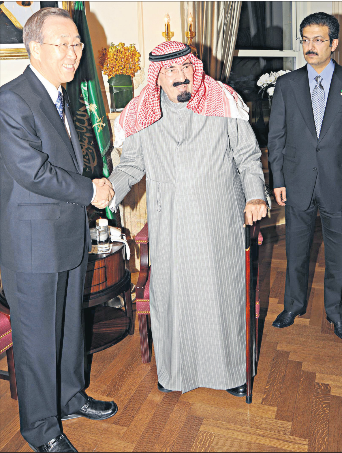
الملك عبد الله مصافحاً بان كي مون وبيدو خالد التويجري رئيس الديوان الملكي.