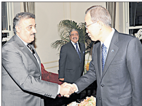
الأمير متعب بن عبد الله مرحباً بأمين عام الأمم المتحدة.