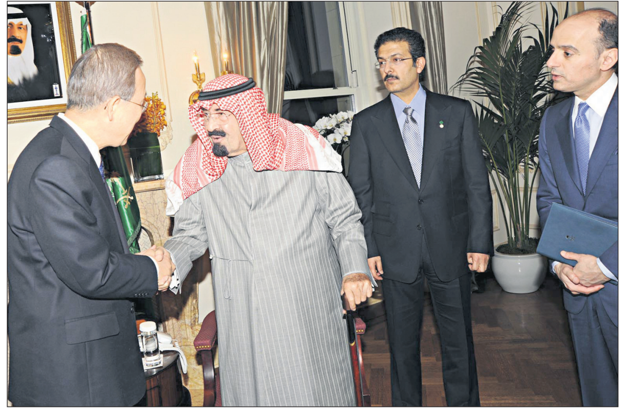
خادم الحرمين الشريفين لدى لقائه الأمين العام للأمم المتحدة في نيويورك البارحة الأولى، وبيدو رئيس الديوان الملكي وسفير المملكة لدى واشنطن.

البارحة الأولى الأمين العام للأمم المتحدة، وأعرب بان كي مون عن سروره ببقاء خادم الحرمين الشريفين وأطمئنانه على صحته عقب العملية الجراحية التي أجريته له ومغادرته للمستشفى متمنياً له دوام الصحة والعافية. وعبر خادم الحرمين الشريفين عن شكره وتقديره للأمين العام للأمم المتحدة على مشاعره الطيبة. حضر الاستقبال صاحب السمو الملكي الأمير مقرن بن عبد العزيز رئيس الاستخبارات