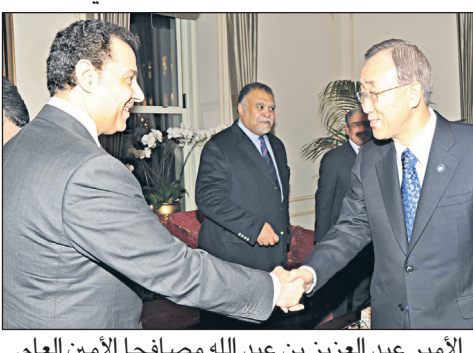
الأمير عبد العزيز بن عبد الله مصافحاً الأمين العام.