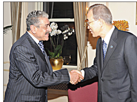
الأمير مقرن بن عبد العزيز يصافح بان كي مون.