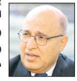
د. نبيل شعث