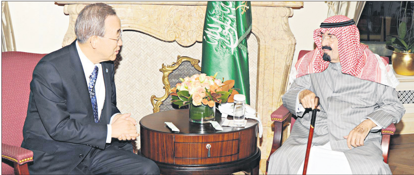
خادم الحرمين الشريفين والأمين العام للأمم المتحدة في جلسة الباحثات.

وخلص المسؤول إلى القول إن الأمم المتحدة تنطاد ملك الإنسانية لدى وصوله أسس مدينة تنهايم مثال المساوية ضمن جولة دولية يعبر خلالها ٥٢ دولة بعد انطلاقته من الرياض في مهرجان الجنادرية. (واس)