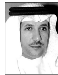
د. فهد عقران

في تحليل عام للأمر الملكي، رأى رئيس تحرير صحيفة المدينة الدكتور فهد ال عقران أن الأمر الملكي يؤكد على ثلاث قضايا، هي: أنه (أي الأمر الملكي) يؤكد التوجه نحو الحرية الإعلامية المنضبطة وبالتالي تكون المصداقية والحياد والشفافية في الطرح ويعزز عدم المساس بالثوابت الدينية والأمنية، ثم يؤكد أن على الإعلاميين تكريس المصداقية والنقد الهادف وعدم الإثارة ليكون إعلاماً رزيناً مؤثراً حتى في المستقبل.