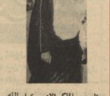
السمو الملكي الامير عبد الله ابن عبد العزيز رئيس الحرس الوطني قادما من جدة بمعية جلالة الملك المعظم .

● وصل الى الرياض اول امس - الاثنين - صاحب ابن عبد العزيز حفل غداء في منزله تكريما للاستاذ محمد الشعلان سكرتير المكتب الثقافي السعودي في بغداد وقد دعي الى